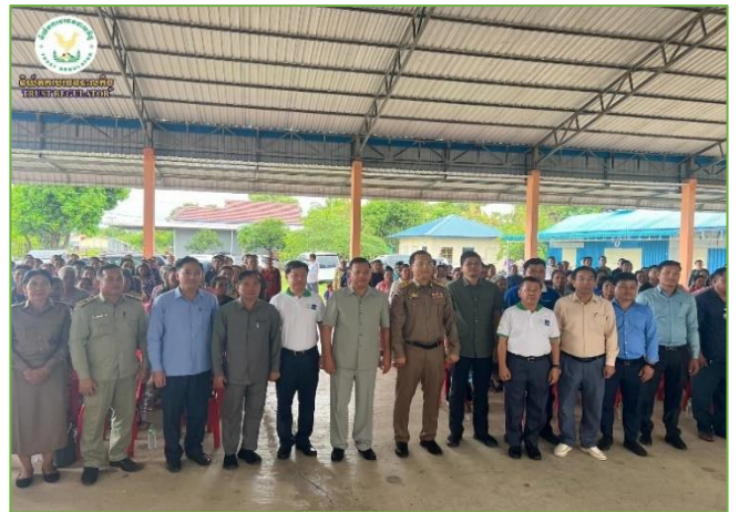
រូបភាព៖ វេទិកាស្តីពី “ការផ្សព្វផ្សាយផលិតផលឥណទាននៃគម្រោង ACSEP កម្រិតសហគមន៍” ។