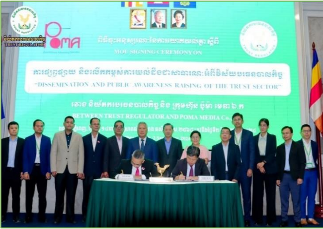
រូបភាព៖ ការចុះអនុស្សរណៈនៃការយោគយល់គ្នា ស្តីពី “ការផ្សព្វផ្សាយ និងលើកកម្ពស់ការយល់ដឹងជាសាធារណៈអំពីវិស័យបធនបាលកិច្ច” ។