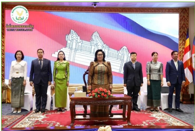
រូបភាព៖ សិក្ខាសាលាផ្សព្វផ្សាយស្តីពី “គោលនយោបាយជាតិបញ្ចប់អេដស៍ និងថិរភាពកម្មវិធីអេដស៍ឆ្នាំ២០២៣-២០២៨”។