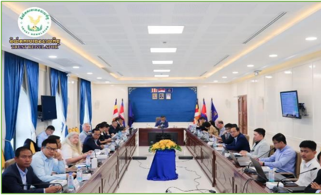
រូបភាព៖ កិច្ចប្រជុំជាមួយប្រតិភូធនាគារអភិវឌ្ឍន៍អាស៊ី (ADB) ស្តីពី “ការពិនិត្យវឌ្ឍនភាពការងារពាក់កណ្តាលអាណត្តិគម្រោង ACSEP”។