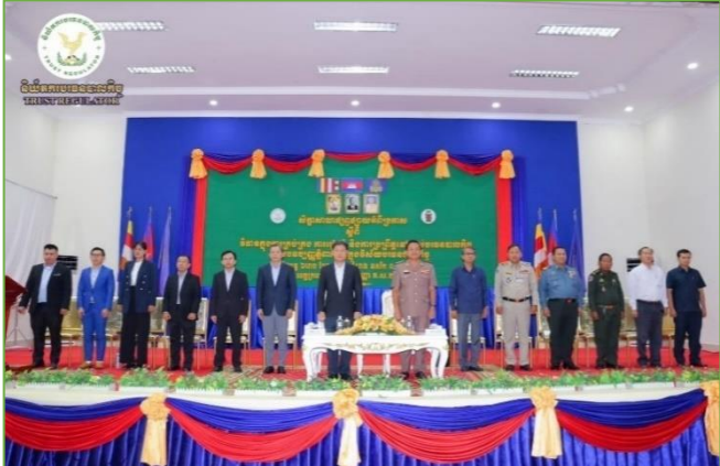
រូបភាព៖ កម្មវិធីសិក្ខាសាលាផ្សព្វផ្សាយអំពីប្រកាសស្តីពី វិធានក្នុងការគ្រប់គ្រង ការរៀបចំ និងការប្រព្រឹត្តទៅរបស់បរទេសបាលកិច្ច និងបទប្បញ្ញត្តិពាក់ព័ន្ធ ក្នុងវិស័យបរទេសបាលកិច្ច។