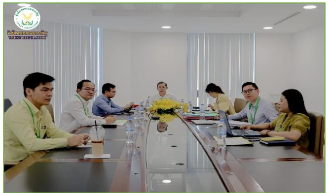
រូបភាព៖ កិច្ចប្រជុំស្តីពី “ការដឹកនាំគណៈកម្មការវាយតម្លៃកម្មវិធីប្រកួត សរសេរអត្ថបទក្នុងវិស័យបរទេសបាលកិច្ច ដើម្បីពិនិត្យ និងវាយតម្លៃលើ សំណេរអត្ថបទរបស់បេក្ខជន ក្នុងកម្មវិធីប្រកួតសរសេរអត្ថបទក្នុងវិស័យ បរទេសបាលកិច្ច”។

នាព្រឹកថ្ងៃអង្គារ ៨កើត ខែក្រប្រទ ឆ្នាំរោង ឆស័ក ព.ស.២៥៦៨ ត្រូវនឹងថ្ងៃទី១០ ខែកញ្ញា គ.ស. ២០២៤ ឯកឧត្តម ណី សាកល អគ្គនាយករងនៃនិយ័តករបរទេសបាលកិច្ច (ន.ប.ជ.) និងជាអនុប្រធាន គណៈកម្មការវាយតម្លៃកម្មវិធីប្រកួតសរសេរអត្ថបទក្នុងវិស័យបរទេស- បាលកិច្ច បានដឹកនាំកិច្ចប្រជុំគណៈកម្មការវាយតម្លៃកម្មវិធីប្រកួត សរសេរអត្ថបទក្នុងវិស័យបរទេសបាលកិច្ច ដើម្បីពិនិត្យ និងវាយតម្លៃ លើសំណេរអត្ថបទរបស់បេក្ខជន ក្នុងកម្មវិធីប្រកួតសរសេរអត្ថបទក្នុង វិស័យបរទេសបាលកិច្ច ក្រោមប្រធានបទ “បរទេសបាលកិច្ច៖ លើសពី ថ្នាលបង្កើនទំនុកចិត្តក្នុងជុំកិច្ច”។ កិច្ចប្រជុំនេះ មានការអញ្ជើញ ចូលរួមពីលោក/លោកស្រី ដែលជាសមាជិក/សមាជិកាគណៈកម្មការ វាយតម្លៃកម្មវិធីប្រកួតសរសេរអត្ថបទក្នុងវិស័យបរទេសបាលកិច្ច ទាំងអស់។