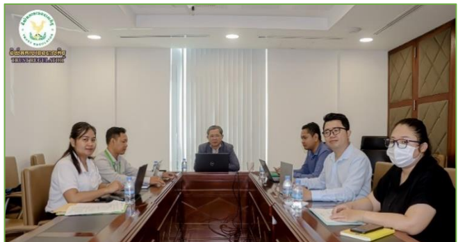
រូបភាព៖ កិច្ចប្រជុំគណៈកម្មការកែទម្រង់ការគ្រប់គ្រងហិរញ្ញវត្ថុសាធារណៈ ដើម្បីពិនិត្យនិងពិភាក្សាលើរបាយការណ៍សមិទ្ធកម្មប្រចាំត្រីមាសទី២ឆ្នាំ២០២៤។

អូន ព័ន្ធមុនីរ័ត្ន ឧបនាយករដ្ឋមន្ត្រី រដ្ឋមន្ត្រីក្រសួងសេដ្ឋកិច្ចនិង ហិរញ្ញវត្ថុ និងមានការអញ្ជើញចូលរួមពី ឯកឧត្តម លោកជំទាវ និងថ្នាក់ ដឹកនាំក្រសួង ស្ថាប័ន និងរដ្ឋបាលថ្នាក់ក្រោមជាតិ តាមប្រព័ន្ធ អនឡាញ Zoom។