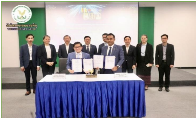
រូបភាព៖ ពិធីចុះអនុស្សរណៈនៃការយោគយល់គ្នារវាងនិយ័តករមូលបត្រកម្ពុជា និងគណៈកម្មាធិការរដ្ឋាភិបាលឌីជីថល។

នាព្រឹកថ្ងៃសុក្រ ៣រោច ខែកទ្របទ ឆ្នាំរោង ឆស័ក ព.ស. ២៥៦៨ ត្រូវនឹងថ្ងៃទី២០ ខែកញ្ញា ឆ្នាំ២០២៤ ឯកឧត្តម ឈី សារល អគ្គនាយករងនៃនិយ័តករបេធនបាលកិច្ច (ន.ប.ធរ) តំណាងដ៏ខ្ពង់ខ្ពស់របស់ ឯកឧត្តម សុខ ដារ៉ា អគ្គនាយកនៃន.ប.ធរ បានអញ្ជើញចូលរួមជាអធិបតីក្នុងពិធីចុះអនុស្សរណៈនៃការយោគយល់គ្នាស្តីពី “កិច្ចសហប្រតិបត្តិការដាក់ឱ្យប្រើប្រាស់ផ្ទៀងផ្ទាត់ឯកសារ verify.gov.kh និងការបណ្តុះបណ្តាលជំនាញឌីជីថលជូនមន្ត្រីនៃនិយ័តករមូលបត្រកម្ពុជា (ន.ម.ក.)” រវាង ន.ម.ក. និងគណៈកម្មាធិការរដ្ឋាភិបាលឌីជីថល និងសិក្ខាសាលាស្តីពី “ការប្រើប្រាស់ និងសេវារដ្ឋាភិបាលឌីជីថលក្នុងវិស័យមូលបត្រ” នៅមជ្ឈមណ្ឌលអភិវឌ្ឍន៍កិច្ច។