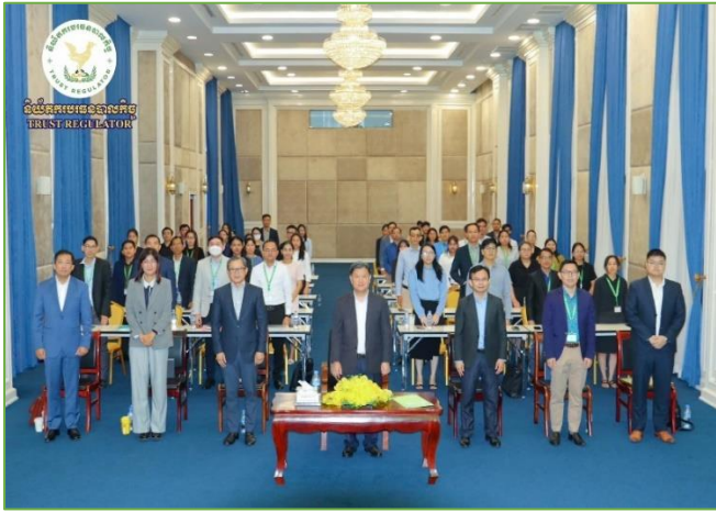
រូបភាព៖ រៀបចំកម្មវិធីបណ្តុះបណ្តាលកសាងសមត្ថភាពមន្ត្រីស្តីពីការចែករំលែកបទពិសោធអំពីយន្តការបេធនបាលកិច្ចឥណទានកាបូននៅកម្ពុជា។