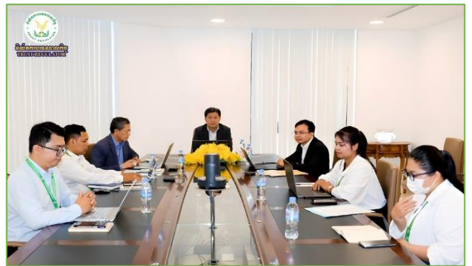
រូបភាព៖ ចូលរួមកិច្ចប្រជុំស្តីពី “បូកសរុបលទ្ធផលនៃការចរចាសម្រាប់ ការរៀបចំសេចក្តីព្រាងច្បាប់ស្តីពីហិរញ្ញវត្ថុសម្រាប់ការគ្រប់គ្រងឆ្នាំ ២០២៥”