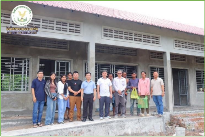
រូបភាព៖ ការចុះត្រួតពិនិត្យមើលវឌ្ឍនភាពនៃការសាងសង់អគារសាលាបឋមសិក្សាប្រឡាយទ្រៀក នៅភូមិប្រឡាយទ្រៀក ឃុំជំរំផុង ស្រុកឆ្លូង ខេត្តក្រចេះ។