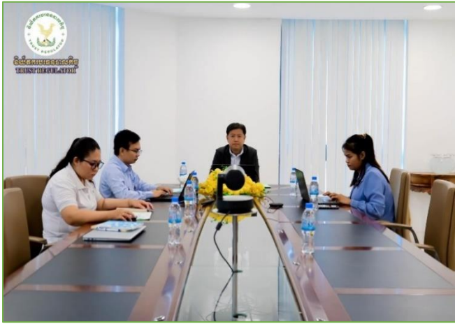
រូបភាព៖ កិច្ចប្រជុំគណៈកម្មការកែទម្រង់ការគ្រប់គ្រងហិរញ្ញវត្ថុសាធារណៈ និងក្រុមការងារបច្ចេកទេស TWG។