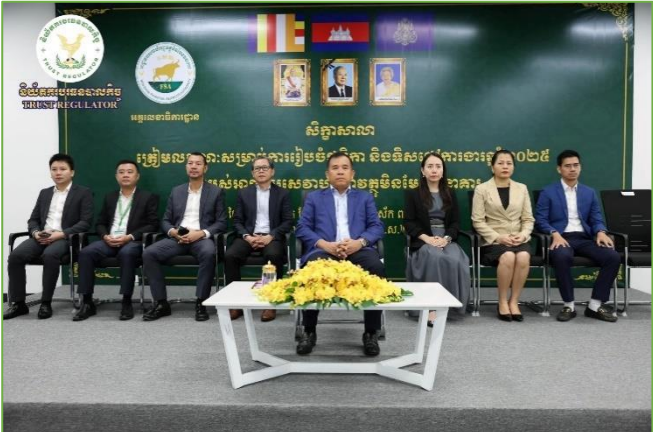
រូបភាព៖ សិក្ខាសាលាត្រៀមលក្ខណៈសម្រាប់ការរៀបចំថវិកា និងទិសដៅ ការងារឆ្នាំ២០២៥ របស់អាជ្ញាធរសេវាហិរញ្ញវត្ថុមិនមែនធនាគារ (អ.ស.ហ.)។

នាព្រឹកថ្ងៃអង្គារ ១៥ កើត ខែកទ្របទ ឆ្នាំរោង ឆស័ក ព.ស. ២៥៦៨ ត្រូវនឹងថ្ងៃទី១៧ ខែកញ្ញា គ.ស.២០២៤ ឯកឧត្តម ឈី សាកល អគ្គនាយកនៃនិយ័តករបរទេសបាលកិច្ច (ន.ប.ជ.) តំណាងដ៏ខ្ពង់ខ្ពស់របស់ ឯកឧត្តម សុខ ជាន់ អគ្គនាយកនៃ និយ័តករបរទេសបាលកិច្ច អមដោយ លោក យុន វ៉ាសនា និងសហការី បានអញ្ជើញចូលរួមសិក្ខាសាលាត្រៀមលក្ខណៈសម្រាប់ការរៀបចំ ថវិកា និងទិសដៅការងារឆ្នាំ២០២៥ របស់អាជ្ញាធរសេវាហិរញ្ញវត្ថុ មិនមែនធនាគារ (អ.ស.ហ.) ក្រោមអធិបតីភាពដ៏ខ្ពង់ខ្ពស់របស់ ឯកឧត្តម ម៉ឺ វ៉ាន់ រដ្ឋលេខាធិការក្រសួងសេដ្ឋកិច្ចនិងហិរញ្ញវត្ថុ និងជាអគ្គលេខាធិការនៃអគ្គលេខាធិការដ្ឋាន អ.ស.ហ. និងមាន ការអញ្ជើញចូលរួមពី ឯកឧត្តម លោកជំទាវ លោក លោកស្រីដែល ជាតំណាងអង្គការក្រោមឱវាទ អ.ស.ហ. នៅមជ្ឈមណ្ឌលអភិវឌ្ឍធុរកិច្ច។