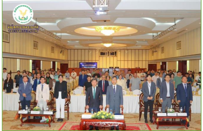
រូបភាព៖ សិក្ខាសាលាផ្សព្វផ្សាយស្តីពី “បរទេសបាលកិច្ច៖ យន្តការប្រកបដោយ ពលានុភាព និងទំនុកចិត្តខ្ពស់សម្រាប់វិនិយោគិនបរទេស”។