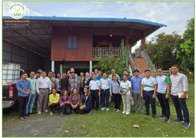
រូបភាព៖ ការចុះត្រួតពិនិត្យ និងវាយតម្លៃការងារពាក់កណ្តាលអាណត្តិ គម្រោង ACSEP នៅខេត្តកំពង់ធំ ព្រះវិហារ និងឧត្តរមានជ័យ។