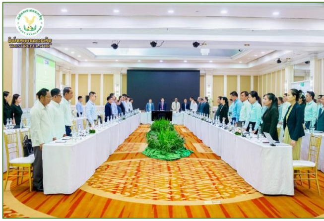
រូបភាព៖ សិក្ខាសាលាពិគ្រោះយោបល់លើសេចក្តីព្រាងសៀវភៅឯកសារ សម្រាប់កម្មវិធីកែទម្រង់ការគ្រប់គ្រងហិរញ្ញវត្ថុសាធារណៈដំណាក់កាលទី៤ "គណនេយ្យភាពសមិទ្ធកម្ម"។ ទំព័រទី៥