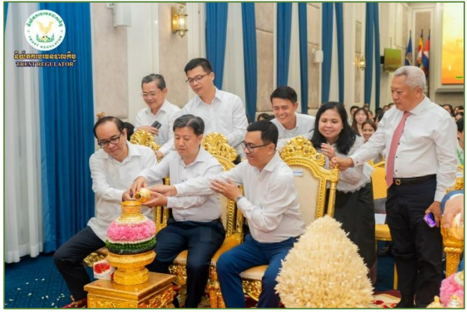
រូបភាព៖ ពិធីចម្រើនព្រះបរិត្ត អបអរពិធីបុណ្យចូលឆ្នាំថ្មី ឆ្នាំរោង ឆស័ក ព.ស.២៥៦៨ និងសូត្រមន្តលើកាសិ សិរីសួស្តី។