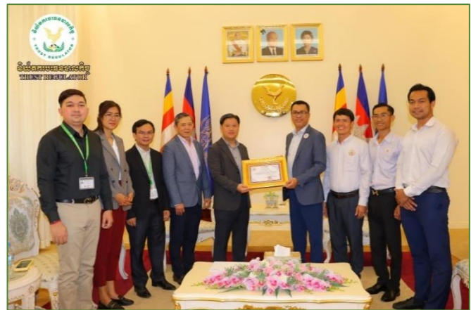
រូបភាព៖ សកម្មភាពនាំយកថវិកាដែលជាការបរិច្ចាគពីថ្នាក់ដឹកនាំ និងមន្ត្រីនៃ ន.ប.ប. ប្រគល់ជូនមូលនិធិគន្ធបុប្ផាកម្ពុជា។