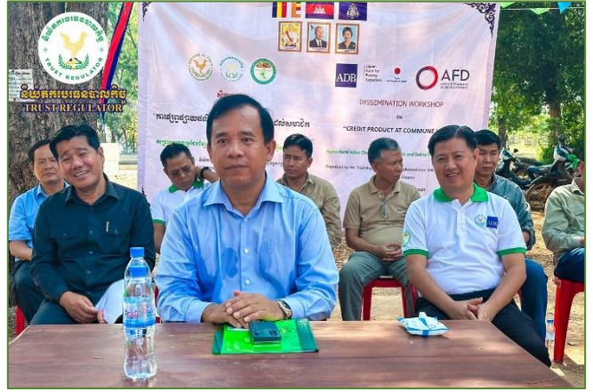
រូបភាព៖ សិក្ខាសាលាស្តីពី "ការផ្សព្វផ្សាយផលិតផលឥណទានដល់សមាជិក សហគមន៍"។