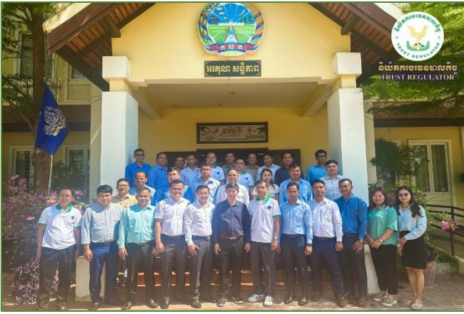
រូបភាព៖ វគ្គបណ្តុះបណ្តាលវិស័យឡើងវិញអំពីការបំពេញទម្រង់ព័ត៌មាន ផលចំណែកបរិស្ថាន និងសង្គម។