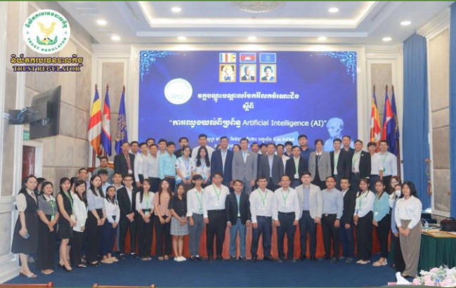
រូបភាព៖ វគ្គបណ្តុះបណ្តាលចែករំលែកចំណេះដឹងស្តីពី "ការលេឃូងយល់ពីប្រព័ន្ធ Artificial Intelligence (AI)"។

ហិរញ្ញវត្ថុមិនមែនធនាគារ (អ.ស.ហ.) នៅទីស្តីការ អ.ស.ហ. ។ ដូចមានកំណត់ក្នុងយុទ្ធសាស្ត្របញ្ជាក់ការណែនាំ-ដំណាក់កាលទី១ របស់រាជរដ្ឋាភិបាល នីតិកាលទី៧ នៃរដ្ឋសភា, វគ្គបណ្តុះបណ្តាលនេះត្រូវបានរៀបចំឡើងស្របតាមផែនការសកម្មភាពរបស់ ន.ប.ធរ ក្នុងការចាប់យកនវានុវត្តន៍បច្ចេកវិទ្យា និងក្នុងគោលបំណងដើម្បីសិក្សាលេឃូងយល់ពីដំណើរការ, របៀបប្រើប្រាស់ និងអត្ថប្រយោជន៍របស់ AI ក្នុងការជួយសម្រួលដល់ការអនុវត្តការងារប្រចាំថ្ងៃ, បង្កើនផលិតភាពការងារ, និងជាទុនចំណេះដឹងបន្ថែមក្នុងការចូលរួមចំណែកអភិវឌ្ឍន៍វិស័យបច្ចេកវិទ្យានៅក្នុងវិស័យបរធនបាលកិច្ចក៏ដូចជាវិស័យហិរញ្ញវត្ថុផងដែរ។