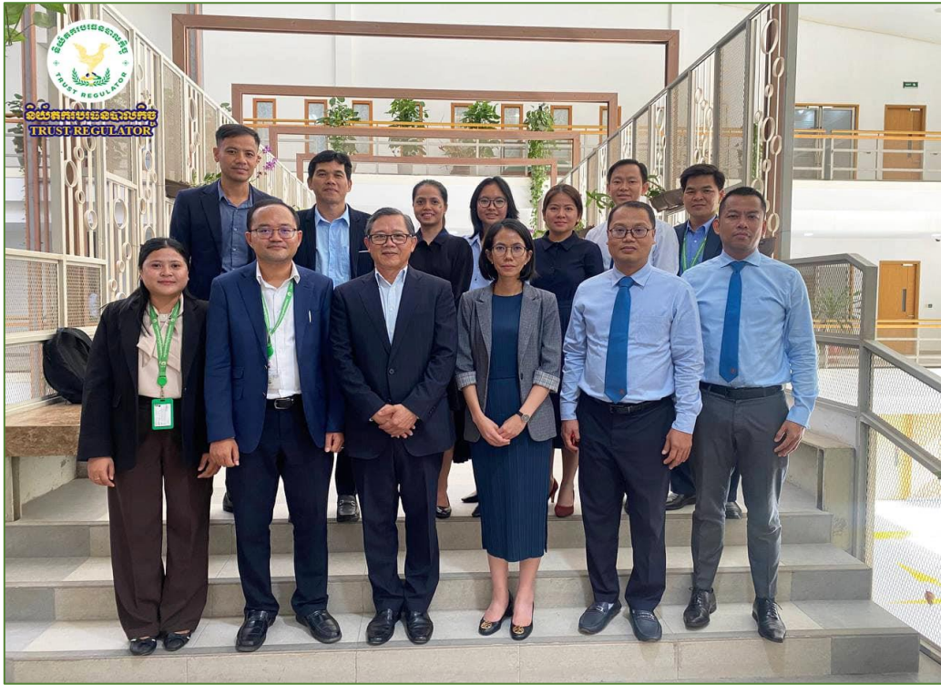
រូបភាព៖ កិច្ចប្រជុំពិភាក្សាការងារជាមួយធនាគារជាតិនៃកម្ពុជា។