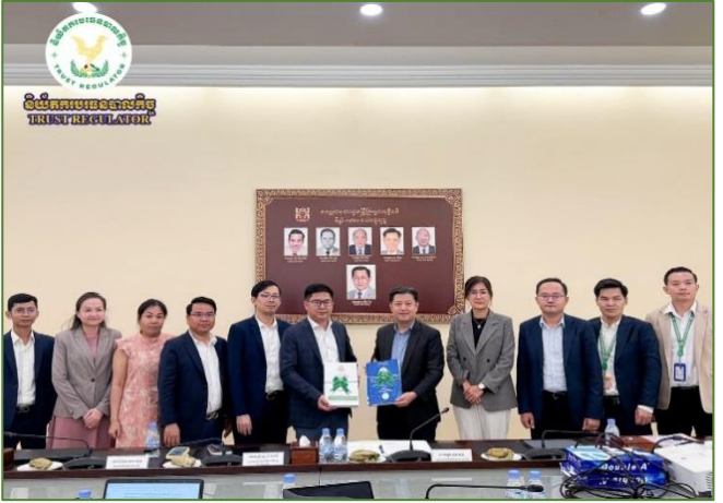
រូបភាព៖ កិច្ចប្រជុំពិភាក្សាការងារជាមួយក្រសួងយុត្តិធម៌។

កិច្ចប្រជុំបានផ្តោតការ ពិភាក្សាអំពីក្របខណ្ឌអភិវឌ្ឍន៍ ស្ថាប័ន, ក្របខណ្ឌច្បាប់និងបទប្បញ្ញត្តិដែលមានជាធរមាន, ការជំរុញ និងការពង្រឹងការអនុវត្តច្បាប់, និងកិច្ចសហការដែលអាចមានក្នុង ក្របខណ្ឌដោះស្រាយវិវាទ, ការបណ្តុះបណ្តាល និងការផ្សព្វផ្សាយ ក៏ដូចជាកិច្ចសហប្រតិបត្តិការផ្សេងទៀត រវាងក្រសួងយុត្តិធម៌ និង និយ័តករបរធនបាលកិច្ច។