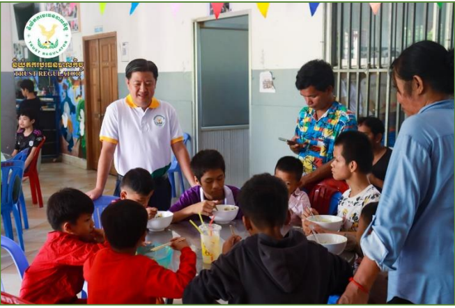
រូបភាព៖ កម្មវិធីសប្បុរសធម៌ នៅមជ្ឈមណ្ឌលទារក និងកុមារជាតិ។

នៅព្រឹកថ្ងៃព្រហស្បតិ៍ ៣កើត ខែចេត្រ ឆ្នាំថោះ បញ្ចស័ក ព.ស. ២៥៦៧ ត្រូវនឹងថ្ងៃទី១១ ខែមេសា ឆ្នាំ២០២៤ ឯកឧត្តម សុខ ដារ៉ា អគ្គនាយកនៃនិយ័តករបរធនបាលកិច្ច ( ន.ប.ធន. ) និងលោកជំទាវរួមដំណើរដោយ ឯកឧត្តមអគ្គនាយករង លោក លោកស្រី ជាថ្នាក់ដឹកនាំបច្ចេកទេស និងសហការីនៃ ន.ប.ធន. បានចុះសួរសុខទុក្ខក៏ដូចជាបន្តលើកទឹកចិត្តដល់ក្មេងៗកំព្រា គ្មានអាណាព្យាបាល និងមានពិការភាព ទាំងការរស់នៅ និងហូបចុក ក៏ដូចជាលើកទឹកចិត្ត និងគាំទ្រដល់បុគ្គលិកបម្រើការងារមើលថែទាំក្មេងៗនៅក្នុងមជ្ឈមណ្ឌលទារក និងកុមារជាតិ ព្រមទាំងមានការរៀបចំជាអាហារ និងភេសជ្ជៈជូនដល់បុគ្គលិក និងក្មេងៗនៅក្នុងមជ្ឈមណ្ឌល។