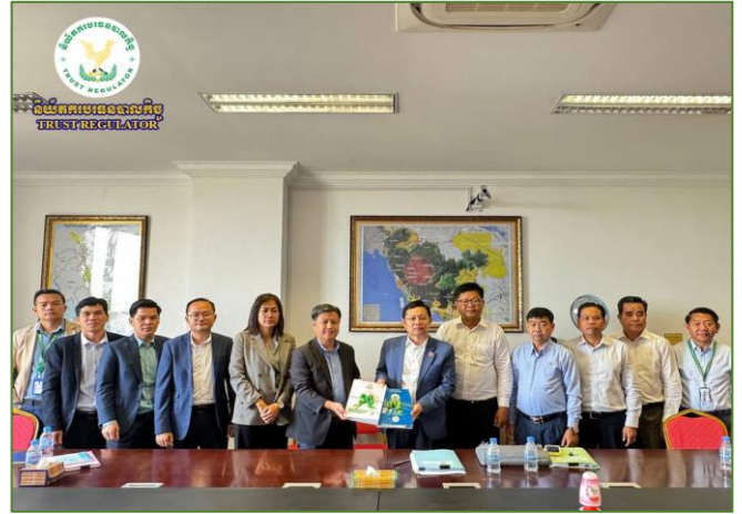
រូបភាព៖ កិច្ចប្រជុំពិភាក្សាការងារជាមួយក្រសួងបរិស្ថាន។