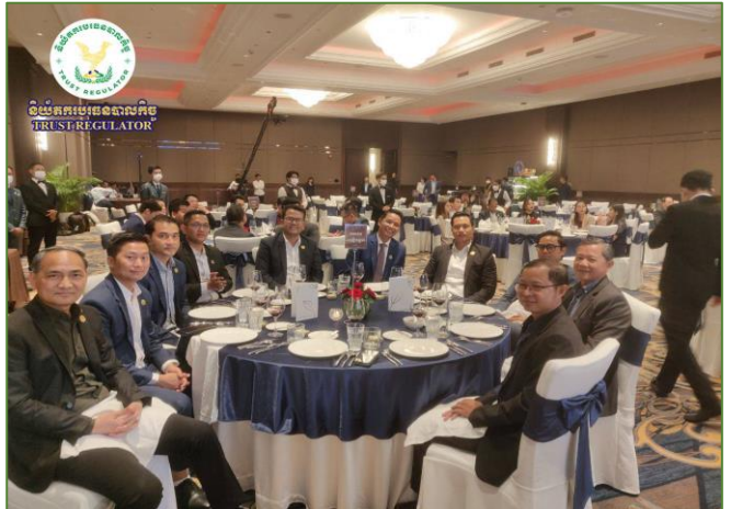
រូបភាព៖ ពិធី "លៀងសាយភោជន សន្និបាតបូកសរុបលទ្ធផលការងារប្រចាំ ឆ្នាំ២០២៣ និងលើកទិសដៅការងារសម្រាប់ឆ្នាំ២០២៤" របស់សមាគម អ្នកអភិវឌ្ឍន៍លំនៅឋានកម្ពុជា។

នាថ្ងៃអង្គារ ៩រោច ខែផល្គុន ឆ្នាំចោះ បញ្ចស័ក ព.ស. ២៥៦៧ ត្រូវនឹងថ្ងៃទី២ ខែមេសា ឆ្នាំ២០២៤ ឯកឧត្តម ធីត ភីហ្វា អគ្គនាយកនៃនិយ័តករបរធនបាលកិច្ច ( ន.ប.ធន. ) តំណាង ដ៏ខ្ពង់ខ្ពស់របស់ ឯកឧត្តម សុខ ដារ៉ា អគ្គនាយកនៃ ន.ប.ធន. បាន អញ្ជើញចូលរួមជាភ្ញៀវកិត្តិយសក្នុងពិធី "លៀងសាយភោជន សន្និបាតបូកសរុបលទ្ធផលការងារប្រចាំឆ្នាំ២០២៣ និងលើក ទិសដៅការងារសម្រាប់ឆ្នាំ២០២៤" របស់សមាគមអ្នកអភិវឌ្ឍន៍ លំនៅឋានកម្ពុជា នៅ ភី អេច ហ្គេន ហល (បុរីប៉េងហូត បឹងស្នៅ)។