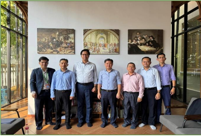
រូបភាព៖ កិច្ចប្រជុំពិភាក្សាការងារជាមួយក្រសួងអប់រំ យុវជន និងកីឡា។