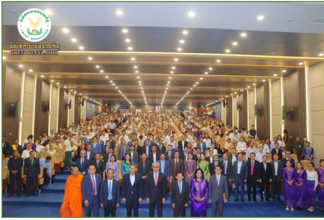
រូបភាព៖ ពិធីសំណេះសំណាលសួរសុខទុក្ខនិវត្តជនរបស់សមាគមសង្គមៈមិត្តបុគ្គលិក មន្ត្រីរាជការនៃក្រសួងសេដ្ឋកិច្ចនិងហិរញ្ញវត្ថុ (កសហវ)។