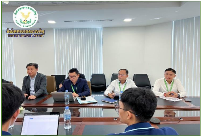
រូបភាព៖ ជំនួបជាមួយក្រុមហ៊ុន Cloudnet Cambodia។