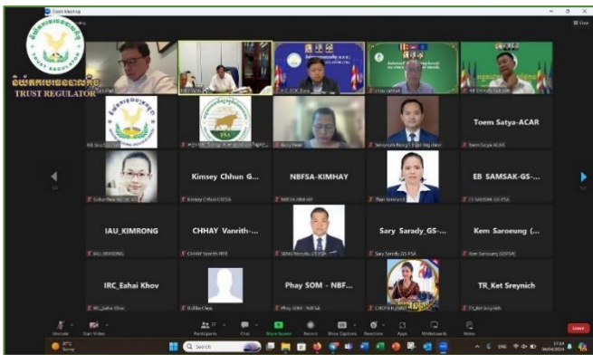
រូបភាព៖ កិច្ចប្រជុំកម្រិតបច្ចេកទេសនៃអាជ្ញាធរសេវាហិរញ្ញវត្ថុមិនមែនធនាគារ (អ.ស.ហ.)។

នារសៀលថ្ងៃព្រហស្បតិ៍ ១១ រោច ខែផល្គុន ឆ្នាំថោះ បញ្ចស័ក ព.ស. ២៥៦៧ ត្រូវនឹងថ្ងៃទី៤ ខែមេសា ឆ្នាំ២០២៤ ឯកឧត្តម សុខ ដារ៉ា អគ្គនាយកនៃនិយ័តករបរធនបាលកិច្ច (ន.ប.ធរ) អមដោយសហការី បានចូលរួមកិច្ចប្រជុំកម្រិតបច្ចេកទេសនៃអាជ្ញាធរសេវាហិរញ្ញវត្ថុមិនមែនធនាគារ (អ.ស.ហ.) ដើម្បីពិនិត្យលើខ្លឹមសារនៃសេចក្តីព្រាងរបាយការណ៍សមិទ្ធផលឆ្នាំ២០២៣ របស់អាជ្ញាធរសេវាហិរញ្ញវត្ថុមិនមែនធនាគារ និងរបាយការណ៍ត្រួតពិនិត្យការអនុវត្តចំណុចប្រចាំឆ្នាំ២០២៣ របស់អាជ្ញាធរសេវាហិរញ្ញវត្ថុមិនមែនធនាគារ ក្រោមការដឹកនាំដ៏ខ្ពង់ខ្ពស់របស់ ឯកឧត្តម រស់ សិលសា អនុប្រធាន អ.ស.ហ. តាមរយៈកិច្ចសម្របសម្រួលរបស់អគ្គលេខាធិការដ្ឋាននៃ អ.ស.ហ. តាមប្រព័ន្ធអនឡាញ (Zoom)។