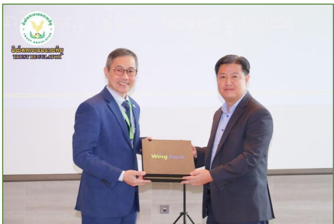
រូបភាព៖ កម្មវិធីបណ្តុះបណ្តាលស្តីពី “យន្តការបរិច្ចាគបាលកិច្ចនៅកម្ពុជា” សម្រាប់ថ្នាក់ដឹកនាំ និងបុគ្គលិករបស់ធនាគារ វីង (ខេមបូឌា) ម.ក។