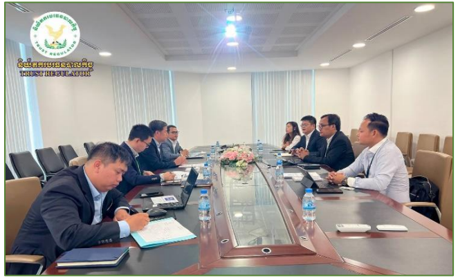
រូបភាព៖ ជំនួបជាមួយក្រុមហ៊ុន V Connect Cambodia។

នាព្រឹកថ្ងៃព្រហស្បតិ៍ ១០កើត ខែចេត្រ ឆ្នាំរោង ឆស័ក ព.ស.២៥៦៧ ត្រូវនឹងថ្ងៃទី១៨ ខែមេសា ឆ្នាំ២០២៤ ឯកឧត្តម សុខ ដារ៉ា អគ្គនាយកនៃនិយ័តករបរិច្ឆេទបាលកិច្ច ( ន.ប.ប. ) អម ដោយសហការី បានអញ្ជើញទទួលជួបជាមួយក្រុមហ៊ុន V Connect Cambodia ដែលជាក្រុមហ៊ុនផ្តល់សេវាកម្មបច្ចេកវិទ្យាព័ត៌មានវិទ្យា នាំមុខមួយក្នុងស្រុក។ តំណាងក្រុមហ៊ុន បានធ្វើបទបង្ហាញអំពី ដំណើរការនៃប្រព័ន្ធគ្រប់គ្រងព័ត៌មានវិទ្យារបស់ក្រុមហ៊ុន ដែលអាច មានផលប្រយោជន៍ និងអាចចូលរួមចំណែកសម្រាប់ការគ្រប់គ្រង ប្រតិបត្តិការបរិច្ឆេទបាលកិច្ចនៅកម្ពុជា។