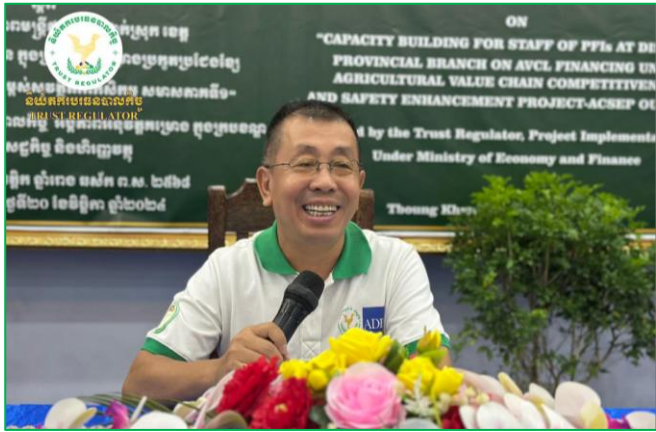
រូបភាពវគ្គបណ្តុះបណ្តាលស្តីពី "ការពង្រឹងសមត្ថភាពមន្ត្រីឥណទានថ្នាក់ ស្រុក ខេត្ត លើប្រតិបត្តិការផ្តល់ឥណទាន ក្នុងក្របខណ្ឌគម្រោងប្រកួតប្រជែង ខ្សែច្រវាក់តម្លៃ និងការលើកកម្ពស់"។

ចាប់ពីថ្ងៃពុធ ៥ រោច ដល់ថ្ងៃសុក្រ ៧ រោច ខែកត្តិក ឆ្នាំរោង ឆស័ក ពុទ្ធសករាជ ២៥៦៨ ត្រូវនឹងថ្ងៃទី២០-២២ ខែវិច្ឆិកា គ.ស. ២០២៤ ដោយទទួលបានការអនុញ្ញាតពី ឯកឧត្តម សុខ ដារ៉ា អគ្គនាយកនៃនិយ័តករបេធនបាលកិច្ច និងជាប្រធានគ្រប់គ្រងគម្រោង ACSEP PIU1, លោក ប៉ូ សំអាង ប្រធាននាយកដ្ឋានស្រាវជ្រាវ បណ្តុះ- បណ្តាល និងសហប្រតិបត្តិការ និងជាប្រធានផ្នែកប្រតិបត្តិការនៃ គម្រោង ACSEP-PIU1 បានដឹកនាំក្រុមការងារ រៀបចំវគ្គបណ្តុះ- បណ្តាលស្តីពី "ការពង្រឹងសមត្ថភាពមន្ត្រីឥណទានថ្នាក់ស្រុក ខេត្តលើ ប្រតិបត្តិការផ្តល់ឥណទាន ក្នុងក្របខណ្ឌគម្រោងប្រកួតប្រជែងខ្សែ ច្រវាក់តម្លៃ និងការលើកកម្ពស់សុវត្ថិភាពពាណិជ្ជកម្ម សមាសភាគទី១" ខេត្តត្បូងឃ្មុំ កំពង់ចាម និងកំពង់ធំ។