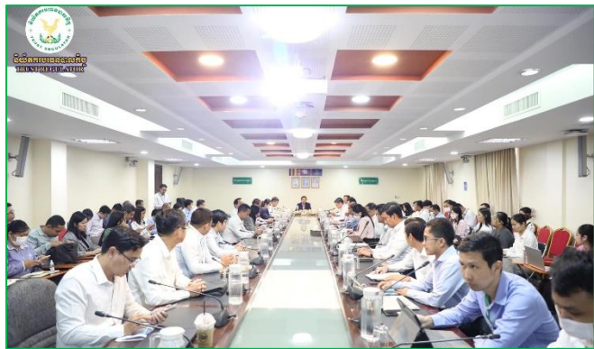
រូបភាព៖ កិច្ចប្រជុំស្តីពីការបំពេញកម្រងសំណួរនៃការពិនិត្យឡើងវិញ និងការ វិភាគមុខងារនិងចរនាសម្ព័ន្ធរបស់អង្គភាពក្រោមខ្នាត និងក្រោមអាណាព្យាបាល ក្រសួងសេដ្ឋកិច្ចនិងហិរញ្ញវត្ថុ (កសហវ)។