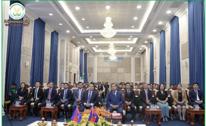
រូបភាពពិធីចុះអនុស្សរណៈស្តីពី “កិច្ចសហប្រតិបត្តិការដាក់ឱ្យប្រើថ្នាលផ្ទៀងផ្ទាត់ឯកសារ និងការរៀបចំវគ្គបណ្តុះបណ្តាលជំនាញឌីជីថល”។

នារសៀលថ្ងៃសុក្រ ១៤រោច ខែកត្តិក ឆ្នាំរោង ឆស័ក ព.ស. ២៥៦៨ ត្រូវនឹងថ្ងៃទី២៩ ខែវិច្ឆិកា គ.ស.២០២៤ ឯកឧត្តម ភី សាភន អគ្គនាយករងនៃនិយ័តករបេធនបាលកិច្ច (ន.ប.ធ.) តំណាងដ៏ខ្ពង់ខ្ពស់របស់ ឯកឧត្តម សុខ ដារ៉ា អគ្គនាយកនៃ ន.ប.ធ. អមដោយសហការី បានអញ្ជើញចូលរួមក្នុងពិធីចុះអនុស្សរណៈនៃការយោគយល់គ្នាស្តីពី “កិច្ចសហប្រតិបត្តិការដាក់ឱ្យប្រើថ្នាលផ្ទៀងផ្ទាត់ឯកសារ verify.gov.kh និងការរៀបចំវគ្គបណ្តុះបណ្តាលជំនាញឌីជីថល” រវាងអាជ្ញាធរសេវាហិរញ្ញវត្ថុមិនមែនធនាគារ (អ.ស.ហ.) និងក្រសួងប្រៃសណីយ៍និងទូរគមនាគមន៍ ក្រោមអធិបតីភាពដ៏ខ្ពង់ខ្ពស់របស់ ឯកឧត្តម ម៉ី វ៉ាន់ រដ្ឋលេខាធិការក្រសួងសេដ្ឋកិច្ចនិងហិរញ្ញវត្ថុ និងជាអគ្គលេខាធិការនៃអគ្គលេខាធិការដ្ឋានអ.ស.ហ. នៅទីស្តីការអ.ស.ហ.។