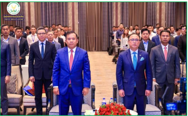
រូបភាព៖ សិក្ខាសាលាពិគ្រោះយោបល់ស្តីពី ផែនការយុទ្ធសាស្ត្រអភិវឌ្ឍ បច្ចេកវិទ្យាហិរញ្ញវត្ថុក្នុងវិស័យហិរញ្ញវត្ថុមិនមែនធនាគារ។

កម្មវិធីសិក្ខាសាលាពិគ្រោះយោបល់នេះមានការអញ្ជើញ ចូលរួមដោយ ឯកឧត្តមរដ្ឋលេខាធិការ អនុរដ្ឋលេខាធិការ ដែលជា តំណាងពីក្រសួងស្ថាប័នពាក់ព័ន្ធ និងវិស័យឯកជន ព្រមទាំងឯកឧត្តម លោកជំទាវ លោក លោកស្រីដែលជាតំណាងនិយ័តករក្រោមខ្នាត អ.ស.ហ. ។