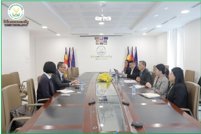
រូបភាព៖ប្រជុំពិភាក្សាការងារអំពីស្ថានភាពទីផ្សារ និងកិច្ចដំណើរការអភិវឌ្ឍន៍វិស័យបឋមប្រទេសកម្ពុជា។