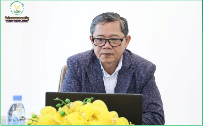
រូបភាព៖ កិច្ចប្រជុំគណៈកម្មាធិការកែទម្រង់ការគ្រប់គ្រងហិរញ្ញវត្ថុសាធារណៈ។

សាធារណៈ ដើម្បីពិនិត្យ និងពិភាក្សាលើរបាយការណ៍សមិទ្ធកម្មប្រចាំត្រីមាសទី៣ គ.ស.២០២៤ ក្រោមអធិបតីភាពដ៏ខ្ពង់ខ្ពស់របស់ ឯកឧត្តម អគ្គបណ្ឌិតសភាចារ្យ អូន ព័ន្ធមុនីរ័ត្ន ឧបនាយករដ្ឋមន្ត្រី រដ្ឋមន្ត្រីក្រសួងសេដ្ឋកិច្ចនិងហិរញ្ញវត្ថុ (កសហវ) និងមានការអញ្ជើញចូលរួមពី ឯកឧត្តម លោកជំទាវ លោក លោកស្រី ដែលជាថ្នាក់ដឹកនាំក្រសួង, ស្ថាប័ន, អង្គការ និងរដ្ឋបាលថ្នាក់ក្រោមជាតិ តាមប្រព័ន្ធអនឡាញ Zoom។