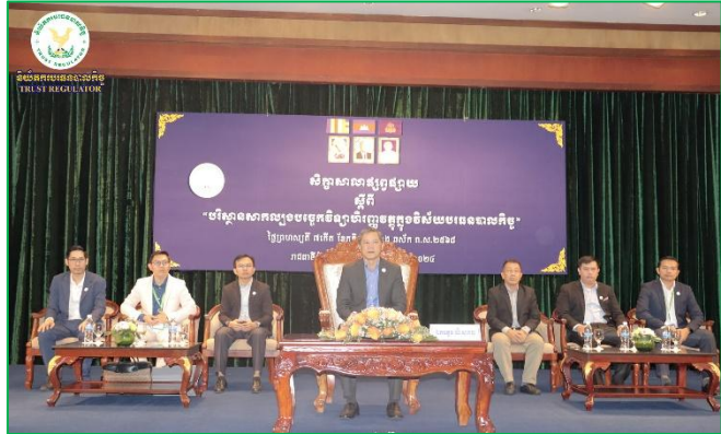
រូបភាព៖ សាលាផ្សព្វផ្សាយស្តីពី "បរិស្ថានសាកល្បងបច្ចេកវិទ្យាហិរញ្ញវត្ថុ ក្នុងវិស័យបធានបាលកិច្ច"។

ហិរញ្ញវត្ថុក្នុងវិស័យបធានបាលកិច្ច" (Guideline on FinTech's Regulatory Sandbox in the Trust Sector) ដែលបានដាក់ឱ្យអនុវត្តជាផ្លូវការ កាលពីថ្ងៃទី១២ ខែធ្នូ ឆ្នាំ២០២៣ កន្លងទៅ។