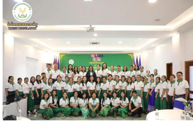
រូបភាពកម្មវិធីវិបស្សនា របស់ក្រុមការងារបច្ច្រាបយេនឌ័រក្រសួងសេដ្ឋកិច្ចនិងហិរញ្ញវត្ថុ (ក.ប.យ.)។

នៅសណ្ឋាគារ សង្កាត់មិត្ត ខេត្តកែប។ កម្មវិធីនេះមានការចូលរួមពីឯកឧត្តម លោកជំទាវអនុរដ្ឋលេខាធិការ លោក លោកស្រីអគ្គនាយកអគ្គនាយករង និងលោក លោកស្រីតំណាងមកពីមន្ទីរសេដ្ឋកិច្ចនិងហិរញ្ញវត្ថុរាជធានី-ខេត្ត ទាំង២៥ និងថ្នាក់ដឹកនាំមន្ត្រីរាជការនៅតាមបណ្តាអង្គភាពក្រោមឱវាទក្រសួងសេដ្ឋកិច្ចនិងហិរញ្ញវត្ថុ។