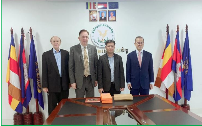
រូបភាព ៖ប្រជុំពិភាក្សាការងារអំពីស្ថានភាពទីផ្សារ និងកិច្ចដំណើរការអភិវឌ្ឍន៍វិស័យបរទេសបាលកិច្ចនៅប្រទេសកម្ពុជា។