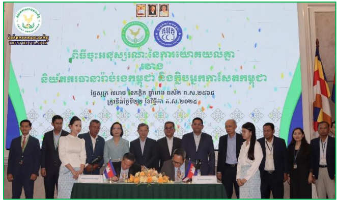
រូបភាពពិធីចុះអនុស្សរណៈស្តីពី "ការពង្រឹងការផ្សព្វផ្សាយ និងលើកកម្ពស់ ការយល់ដឹង អំពីសេវាធានារ៉ាប់រងកម្ពុជា"។

ជាអធិបតីក្នុងពិធីចុះអនុស្សរណៈនៃការយោគយល់គ្នារវាងនិយ័តករ ធានារ៉ាប់រងកម្ពុជា និងភ្នាក់ងារសេដ្ឋកិច្ចជាតិ ការពង្រឹងការ ផ្សព្វផ្សាយ និងលើកកម្ពស់ការយល់ដឹង អំពីសេវាធានារ៉ាប់រងកម្ពុជា។ នៅអាជ្ញាធរសេវាហិរញ្ញវត្ថុមិនមែនធនាគារ ។