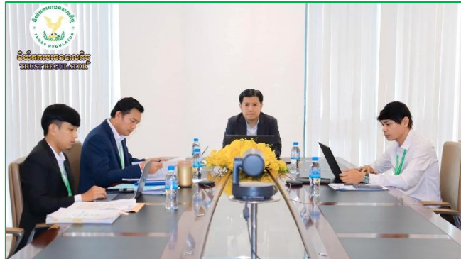
រូបភាព៖កិច្ចប្រជុំពិភាក្សាលើសេចក្តីព្រាងអនុក្រឹត្យចំនួន ២ និងប្រកាសចំនួន ១ របស់ថ្នាក់ដឹកនាំក្រសួងសេដ្ឋកិច្ចនិងហិរញ្ញវត្ថុ។