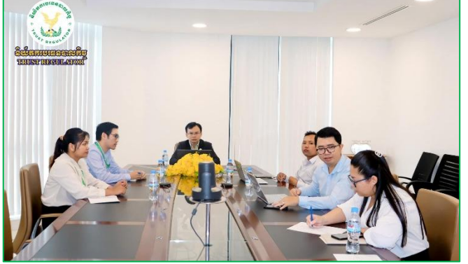
រូបភាពកិច្ចប្រជុំ គណៈកម្មាធិការដឹកនាំការងារកែទម្រង់ការគ្រប់គ្រងហិរញ្ញវត្ថុសាធារណៈ។

ដើម្បីពិនិត្យ និងពិភាក្សាលើរបាយការណ៍សមិទ្ធកម្មប្រចាំត្រីមាសទី៣ គ.ស.២០២៤ ក្រោមអធិបតីភាពដ៏ខ្ពង់ខ្ពស់របស់ ឯកឧត្តមអគ្គបណ្ឌិត សភាចារ្យ មុន ព័ន្ធមុនីរ័ត្ន ឧបនាយករដ្ឋមន្ត្រី រដ្ឋមន្ត្រីក្រសួងសេដ្ឋកិច្ចនិងហិរញ្ញវត្ថុ និងមានការអញ្ជើញចូលរួមពី ឯកឧត្តម លោក-ជំទាវ លោក លោកស្រីដែលជាថ្នាក់ដឹកនាំ ក្រសួង ស្ថាប័ន អង្គភាព និងរដ្ឋបាលថ្នាក់ក្រោមជាតិ តាមប្រព័ន្ធអនឡាញ Zoom។