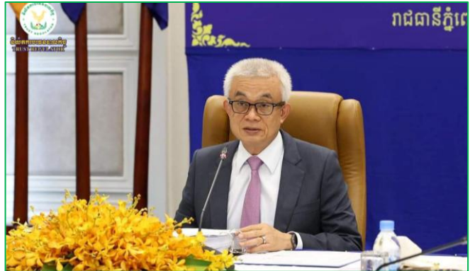
រូបភាព៖ កិច្ចប្រជុំក្រុមប្រឹក្សា អ.ស.ហ. អាណត្តិទី១ លើកទី២០។