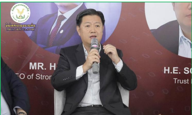
រូបភាព៖កម្មវិធី "វេទិកាខេមអេដ មូលបត្រ និងបធនបាលកិច្ច"។