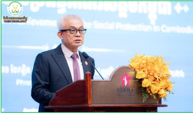
រូបភាព៖សន្និសីទជាតិស្តីពី "សមិទ្ធផលនៃប្រព័ន្ធគាំពារសេដ្ឋកិច្ច" ។