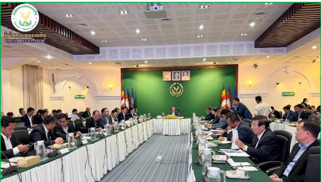
រូបភាព៖កិច្ចប្រជុំលើកទី២ លើសេចក្តីព្រាងឯកសារយុទ្ធសាស្ត្រស្តីពីការរៀបចំសេវាអេឡិចត្រូនិកសម្រាប់ធុរកិច្ច ២០២៥-២០២៨ ។