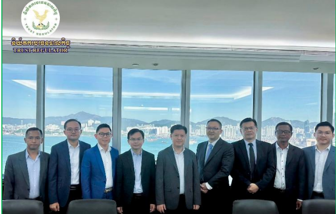
រូបភាព៖ទស្សនកិច្ចសិក្សា និងប្រជុំពិភាក្សាការងារជាមួយសមាគមបឋមប្រទេស និងក្រុមហ៊ុនបឋមប្រទេស នៅទីក្រុងហុងកុងនៃសាធារណរដ្ឋប្រជាមានិតចិន។