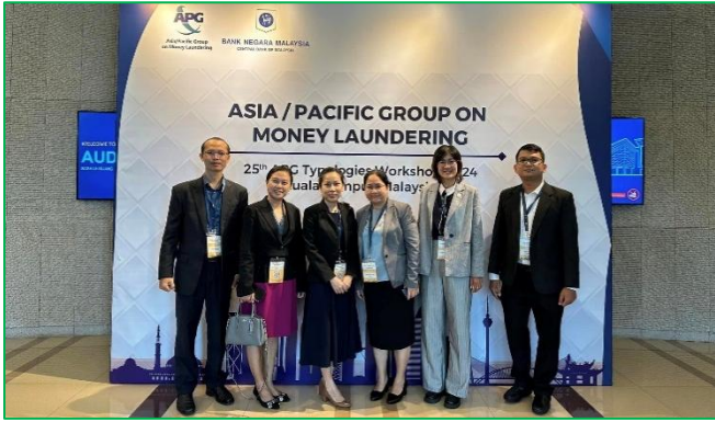
រូបភាព៖សិក្ខាសាលាគំរូប្រចាំឆ្នាំ២០២៤ស្តីពី "25th APG Typology Workshop 2024"