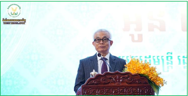
រូបភាពកម្មវិធីទិវាប្រព័ន្ធអេកូឡូស៊ី សហគ្រិនភាព២០២៤។