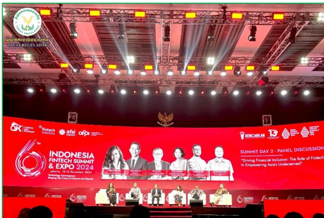
រូបភាព៖សន្និបាតបច្ចេកវិទ្យាហិរញ្ញវត្ថុឥណ្ឌូនេស៊ី លើកទី៦ គ.ស. ២០២៤ ក្រោមមូលបទ "ចំណុចរួមនៃបច្ចេកវិទ្យា៖ ការបង្កើតអនាគតនៃហិរញ្ញវត្ថុ និងលើសពីនេះ"។