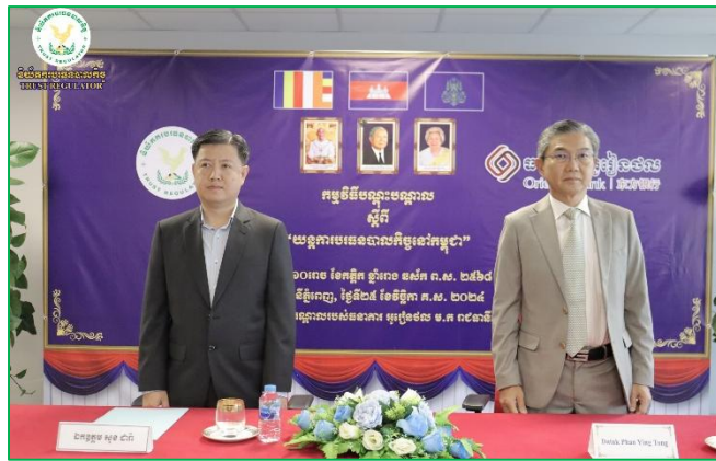
រូបភាព ៖បណ្តុះបណ្តាលស្តីពី “យន្តការបរទេសបាលកិច្ចនៅកម្ពុជា”។