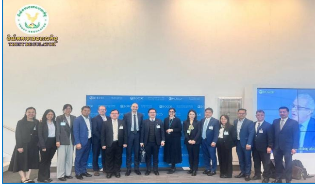
រូបភាព៖ កិច្ចប្រជុំការពារ “របាយការណ៍វាយតម្លៃកម្ពុជាលើការផ្លាស់ប្តូរព័ត៌មានពន្ធ”។

កិច្ចប្រជុំនេះ មានការចូលរួមពីគណៈប្រតិភូកម្ពុជា រួមមានតំណាងអគ្គនាយកដ្ឋានពន្ធដារ, និយ័តករគណនេយ្យនិងសវនកម្ម និងអង្គការស៊ើបការណ៍ហិរញ្ញវត្ថុកម្ពុជា ព្រមទាំងមានការចូលរួមពីប្រតិភូនៃប្រទេសសមាជិកនៃ PRMG ចំនួន ៤២ ប្រទេស នៃតំបន់អឺរ៉ុប អាមេរិកខាងជើងនិងខាងត្បូង អាស៊ីប៉ាស៊ីហ្វិក មជ្ឈិមបូព៌ានិងអាហ្វ្រិកខាងត្បូង។