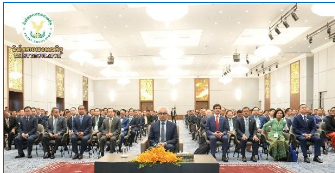
រូបភាព៖ ពិធីបិទកិច្ចប្រជុំត្រួតពិនិត្យប្រចាំឆ្នាំ២០២៥ នៃការអនុវត្តកម្មវិធីកែទម្រង់ការគ្រប់គ្រងហិរញ្ញវត្ថុសាធារណៈ ដំណាក់កាលទី៤។

នារសៀលថ្ងៃពុធ ១៥ រោច ខែផល្គុន ឆ្នាំម្សាញ់ សប្តស័ក ព.ស.២៥៦៩ ត្រូវនឹងថ្ងៃទី១៥ ខែមីនា ឆ្នាំ២០២២ ដោយទទួលបានការអនុញ្ញាត និងចាត់តាំងពី ឯកឧត្តម សុខ ដារ៉ា អគ្គនាយកនៃនិយ័តករបធនបាលកិច្ច ( ន.ប.ជ. ), ឯកឧត្តម ឈី សាភល អគ្គនាយករងនៃ ន.ប.ជ. អមដោយសហការី បានអញ្ជើញចូលរួមពិធីបិទកិច្ចប្រជុំត្រួតពិនិត្យប្រចាំឆ្នាំ២០២៥ នៃការអនុវត្តកម្មវិធីកែទម្រង់ការគ្រប់គ្រងហិរញ្ញវត្ថុសាធារណៈ ដំណាក់កាលទី៤ ក្រោមអធិបតីភាពដ៏ខ្ពង់ខ្ពស់របស់ ឯកឧត្តមអគ្គបណ្ឌិតសភាចារ្យ ហួន ធីន្ទុនីរ័ត្ន ឧបនាយករដ្ឋមន្ត្រី រដ្ឋមន្ត្រីក្រសួងសេដ្ឋកិច្ចនិងហិរញ្ញវត្ថុ និងមានការអញ្ជើញចូលរួមពីតំណាងដៃគូអភិវឌ្ឍ ឯកឧត្តមលោកជំទាវ លោក លោកស្រីដែលជាថ្នាក់ដឹកនាំ ក្រសួង ស្ថាប័នអង្គការ និងរដ្ឋបាលថ្នាក់ក្រោមជាតិ នៅអគារអគ្គនាយកដ្ឋានពន្ធដារ។