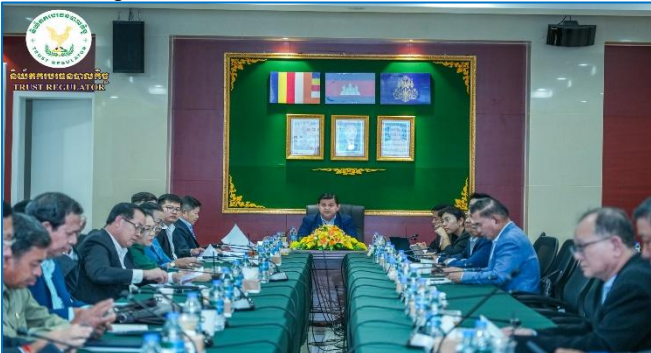
រូបភាព៖ កិច្ចប្រជុំអន្តរក្រសួងលើកទី២ ដើម្បីពិនិត្យ និងពិភាក្សាលើ “សេចក្តីព្រាង អនុក្រឹត្យស្តីពីការបង្កើតមូលនិធិកិច្ចប្រជុំអន្តរក្រសួង តេជោសែន”។