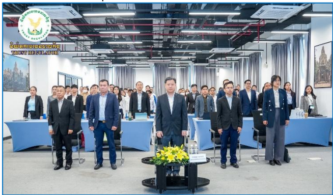
រូបភាព៖ សិក្ខាសាលាផ្សព្វផ្សាយ “ប្រកាសស្តីពីការដាក់ទណ្ឌកម្មខាងវិស័យ ចំពោះបុគ្គលរាយការណ៍ក្នុងវិស័យបរទេសបាលកិច្ចដែលមិនអនុវត្តតាមច្បាប់ ស្តីពីការប្រឆាំងការសម្អាតប្រាក់និងហិរញ្ញប្បទានភេរវកម្ម”។

គោលដៅផ្សព្វផ្សាយដល់ក្រុមហ៊ុនបរទេសបាល, បរទេសបាលរូបវន្ត បុគ្គលឯករាជ្យ និងប្រតិបត្តិករបរទេសបាល ដែលជាបុគ្គលរាយការណ៍ ក្នុងវិស័យបរទេសបាលកិច្ច ឱ្យយល់ដឹងបន្ថែមអំពីកាតព្វកិច្ច និង ការទទួលខុសត្រូវក្នុងវិធានការយកចិត្តទុកដាក់ស្តារអតិថិជន ការរក្សាទុកឯកសារ កម្មវិធីសម្រាប់ទប់ស្កាត់ការប្រឆាំងការសម្អាតប្រាក់ និងហិរញ្ញប្បទានភេរវកម្ម និងកាតព្វកិច្ចផ្សេងទៀត ដើម្បីលើកកម្ពស់ សកម្មភាពប្រឆាំងការសម្អាតប្រាក់និងហិរញ្ញប្បទានភេរវកម្ម ក្នុង គោលបំណងជំរុញអនុលោមភាពតាមច្បាប់ស្តីពីការប្រឆាំងការសម្អាត ប្រាក់និងហិរញ្ញប្បទានភេរវកម្ម ព្រមទាំងស្របតាមអនុសាសន៍របស់ ក្រុមការងារហិរញ្ញវត្ថុ (FATF)។