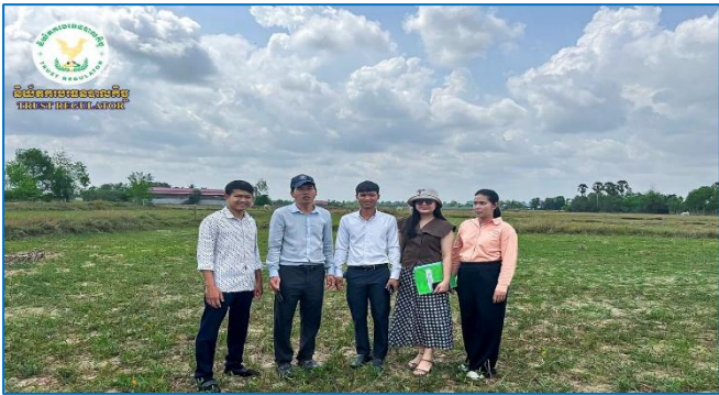
រូបភាព៖ សកម្មភាពមន្ត្រីជំនាញនៃ ន.ប.ប. ចុះត្រួតពិនិត្យដល់ទីកន្លែងទីតាំងអចលនវត្ថុនៃបរធនបាលកិច្ចពាណិជ្ជកម្ម។

ចាប់ពីថ្ងៃចន្ទ ១៣រោចខែផល្គុន ដល់ថ្ងៃសុក្រ ៣កើតខែចេត្រ ឆ្នាំម្សាញ់ សប្តស័ក ព.ស.២៥៦៩ ត្រូវនឹងថ្ងៃទី១៦-២១ ខែមីនា ឆ្នាំ២០២៦ ដោយទទួលបានការអនុញ្ញាត និងការចាត់តាំងពី ឯកឧត្តម សុខ ជារ៉ា អគ្គនាយកនៃនិយ័តករបរធនបាលកិច្ច ( ន.ប.ប. ), លោកស្រី ស៊ុន សុមាល័យ អនុប្រធាននាយកដ្ឋានចុះបញ្ជីបរធនបាលកិច្ច បានដឹកនាំមន្ត្រីជំនាញនៃ ន.ប.ប. ចុះត្រួតពិនិត្យដល់ទីកន្លែងទីតាំងអចលនវត្ថុនៃបរធនបាលកិច្ចពាណិជ្ជកម្ម ដែលស្ថិតនៅរាជធានីភ្នំពេញ ខេត្តកំពង់ស្ពឺ និងខេត្តតាកែវ ដើម្បីពិនិត្យនិងផ្ទៀងផ្ទាត់ការស្នើសុំបង្កើត និងចុះបញ្ជីបរធនបាលកិច្ចនៅ ន.ប.ប. ចំនួន ៣ ករណី និងកំពុងធ្វើប្រតិបត្តិការដោយក្រុមហ៊ុនបរធនបាលដែលទទួលបានអាជ្ញាប័ណ្ណពី ន.ប.ប. ។