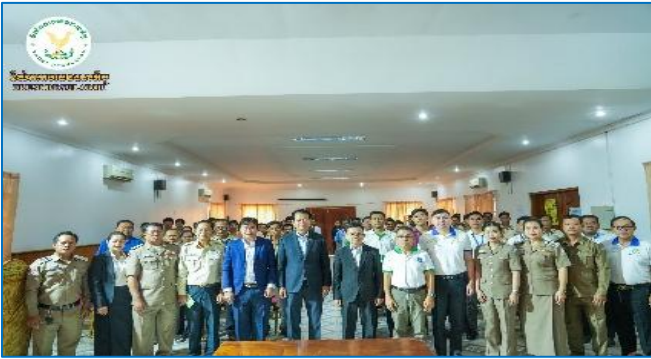
រូបភាព៖ សិក្ខាសាលាស្តីពី “ការផ្សព្វផ្សាយផលិតផលឥណទានក្នុងក្របខណ្ឌគម្រោងប្រកួតប្រជែងខ្សែច្រវាក់តម្លៃ និងការលើកកម្ពស់សុវត្ថិភាពកសិកម្ម (ACSEP) ដល់រដ្ឋបាលខេត្តគោលដៅថ្មី”។