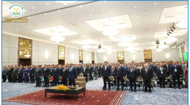
រូបភាព៖ កិច្ចប្រជុំត្រួតពិនិត្យប្រចាំឆ្នាំ២០២៥ នៃការអនុវត្តកម្មវិធីកែទម្រង់ ការគ្រប់គ្រងហិរញ្ញវត្ថុសាធារណៈ ដំណាក់កាលទី៤។

នាព្រឹកថ្ងៃអង្គារ ១៤ រោច ខែផល្គុន ឆ្នាំម្សាញ់ សប្តស័ក ព.ស. ២៥៦៩ ត្រូវនឹងថ្ងៃទី១៧ ខែមីនា ឆ្នាំ២០២៦ ឯកឧត្តម សុខ ដារ៉ា អគ្គនាយកនៃនិយ័តករបឋមធនបាលកិច្ច ( ន.ប.ប. ) អមដោយសហការី បានអញ្ជើញចូលរួមកិច្ចប្រជុំត្រួតពិនិត្យប្រចាំ- ឆ្នាំ២០២៥ នៃការអនុវត្តកម្មវិធីកែទម្រង់ការគ្រប់គ្រងហិរញ្ញវត្ថុ សាធារណៈ ដំណាក់កាលទី៤ ក្រោមអធិបតីភាពដ៏ខ្ពង់ខ្ពស់របស់ ឯកឧត្តមអគ្គបណ្ឌិតសភាចារ្យ ហួន ព័ន្ធមុនីរ័ត្ន ឧបនាយក រដ្ឋមន្ត្រី រដ្ឋមន្ត្រីក្រសួងសេដ្ឋកិច្ចនិងហិរញ្ញវត្ថុ និងមានការអញ្ជើញ ចូលរួមពីតំណាងដៃគូអភិវឌ្ឍ ឯកឧត្តម លោកជំទាវ លោក លោក ស្រីដែលជាថ្នាក់ដឹកនាំ ក្រសួង ស្ថាប័នអង្គការ និងរដ្ឋបាលថ្នាក់ក្រោម ជាតិ នៅអគារអគ្គនាយកដ្ឋានពន្ធដារ។