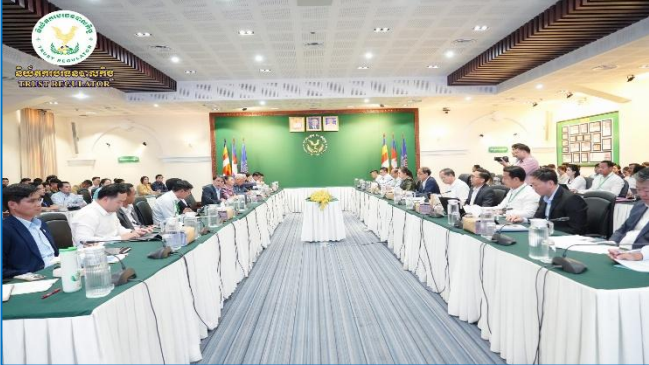
រូបភាព៖ កិច្ចប្រជុំស្តីពី "កិច្ចពិភាក្សាលើសេចក្តីព្រាងអនុក្រឹត្យស្តីពីការកំណត់ និងការពិពណ៌នាមុខតំណែងវិជ្ជាជីវៈសវនកម្មផ្ទៃក្នុង នៃក្រសួងសេដ្ឋកិច្ច និងហិរញ្ញវត្ថុ"។

នៅព្រឹកថ្ងៃព្រហស្បតិ៍ ២៣ ខែមេសា ឆ្នាំ២០២៦ សប្តាហ៍ ៧.៧. ២៥៦៩ ត្រូវនឹងថ្ងៃទី៥ ខែមេសា ឆ្នាំ២០២៦ និយ័តករបរទេស- បាលកិច្ច ( ន.ប.ប. ) បានរៀបចំសិក្ខាសាលាផ្សព្វផ្សាយ "ប្រកាស ស្តីពីការដាក់ទណ្ឌកម្មខាងវិស័យចំពោះបុគ្គលរាយការណ៍ក្នុងវិស័យ បរទេសបាលកិច្ចដែលមិនអនុវត្តតាមច្បាប់ស្តីពីការប្រឆាំងការសម្អាត ប្រាក់និងហិរញ្ញប្បទានភេរកម្ម" ក្រោមអធិបតីភាពដ៏ខ្ពង់ខ្ពស់របស់ ឯកឧត្តម សុខ ដារ៉ា អគ្គនាយកនៃ ន.ប.ប. នៅអាគារមជ្ឈ- មណ្ឌលអភិវឌ្ឍន៍កិច្ច។ សិក្ខាសាលានេះ ត្រូវបានរៀបចំឡើងក្នុង