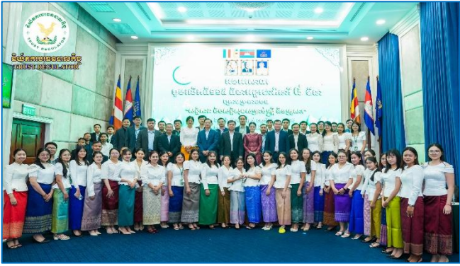
រូបភាព៖ កម្មវិធីអបអរសាទរខួបលើកទី១១៥ ទិវាអន្តរជាតិនារី ៨ មីនា ឆ្នាំ២០២៦។