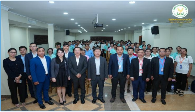
រូបភាព៖ សិក្ខាសាលាស្តីពី "ការល្អិតល្អន់ពីកិច្ចដំណើរការអភិវឌ្ឍន៍វិស័យ បរទេសបាលកិច្ចនៅព្រះរាជាណាចក្រកម្ពុជា"។