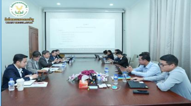
រូបភាព៖ កិច្ចប្រជុំពិភាក្សារវាងថ្នាក់ដឹកនាំ ន.ប.ប. ជាមួយក្រសួងរៀបចំដែនដី នគរូបនីយកម្ម និងសំណង់។