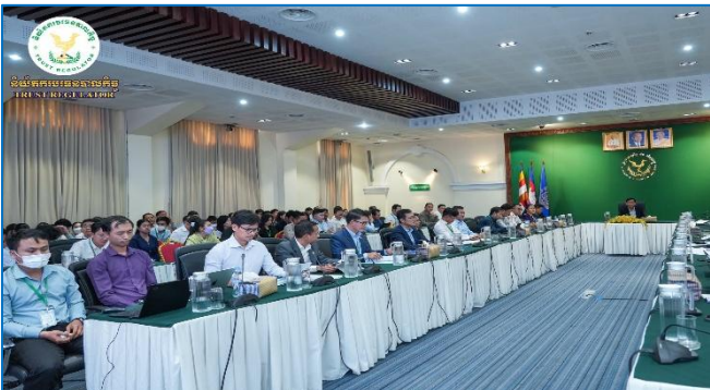
រូបភាព៖ កិច្ចប្រជុំពិនិត្យពិភាក្សាលើការរៀបចំសេចក្តីព្រាងអនុក្រឹត្យស្តីពីការកំណត់និងការពិពណ៌នាមុខតំណែងវិជ្ជាជីវៈឯកទេស នៃ កសហវ ។

នារសៀលថ្ងៃអង្គារ ៦កើត ខែចេត្រ ឆ្នាំម្សាញ់ សប្តស័ក ព.ស.២៥៦៩ ត្រូវនឹងថ្ងៃទី២៤ ខែមីនា ឆ្នាំ២០២៦, ដោយទទួលបានការអនុញ្ញាត និងចាត់តាំងពី ឯកឧត្តម សុខ ជារ៉ា អគ្គនាយកនៃនិយ័តករបរធនបាលកិច្ច ( ន.ប.ប. ), លោក យុន វាសនា អគ្គនាយករងនៃ ន.ប.ប. អមដោយសហការី បានចូលរួមកិច្ចប្រជុំពិនិត្យពិភាក្សាលើការរៀបចំសេចក្តីព្រាងអនុក្រឹត្យស្តីពីការកំណត់និងការពិពណ៌នាមុខតំណែងវិជ្ជាជីវៈឯកទេស នៃក្រសួងសេដ្ឋកិច្ចនិងហិរញ្ញវត្ថុ ( កសហវ ) ក្រោមអធិបតីភាពរបស់ ឯកឧត្តម ឯក ចន្ទា អគ្គលេខាធិការនៃអគ្គលេខាធិការដ្ឋាន កសហវ និងមានការអញ្ជើញចូលរួមពី ឯកឧត្តម លោកជំទាវ លោក លោកស្រីដែលជាថ្នាក់ដឹកនាំស្ថាប័ន និងអង្គការក្រោមឱវាទ កសហវ នៅទីស្តីការ កសហវ ។