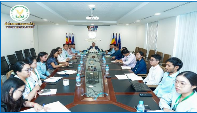
រូបភាព៖ កិច្ចប្រជុំបុគ្គលិកសម្រាប់ការងារប្រចាំខែកុម្ភៈ ឆ្នាំ២០២៦ និងទិសដៅការងារប្រចាំខែមីនា ឆ្នាំ២០២៦។