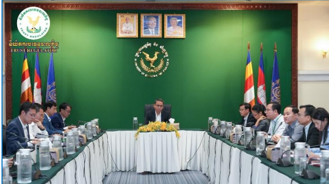
រូបភាព៖ កិច្ចប្រជុំផ្សព្វផ្សាយសារព័ត៌មានសំន្តីពី "ការអនុវត្តច្បាប់ស្តីពីហិរញ្ញវត្ថុ សម្រាប់គ្រប់គ្រងឆ្នាំ២០២៦"។

នៅសៀលថ្ងៃចន្ទ ១៤ កើត ខែមេសា ឆ្នាំ២០២៦ សប្តាហ៍ ៧.៧. ២៥៦៩ ត្រូវនឹងថ្ងៃទី២ ខែមេសា ឆ្នាំ២០២៦, ដោយទទួលបាន ការអនុញ្ញាត និងចាត់តាំងពី ឯកឧត្តម សុខ ដារ៉ា អគ្គនាយក នៃនិយ័តករបរទេសបាលកិច្ច ( ន.ប.ប. ), ឯកឧត្តម ណី សាគល អគ្គនាយករងនៃនិយ័តករបរទេសបាលកិច្ច ( ន.ប.ប. ) បានអញ្ជើញ ចូលរួមកិច្ចប្រជុំស្តីពី "កិច្ចពិភាក្សាលើសេចក្តីព្រាងអនុក្រឹត្យស្តីពី ការកំណត់និងការ ពិពណ៌នាមុខតំណែងវិជ្ជាជីវៈសវនកម្មផ្ទៃក្នុង នៃ ក្រសួងសេដ្ឋកិច្ចនិងហិរញ្ញវត្ថុ" ក្រោមអធិបតីភាពដ៏ខ្ពង់ខ្ពស់របស់ ឯកឧត្តម ហង លី សុខសាន រដ្ឋលេខាធិការ និងជាប្រធាន ក្រុមការងារកែទម្រង់រដ្ឋបាលសាធារណៈ នៃ កសប ព្រមទាំង មានការអញ្ជើញចូលរួមពីឯកឧត្តម លោកជំទាវ លោក លោកស្រី ដែលជាថ្នាក់ដឹកនាំក្រសួង ស្ថាប័ន និងតំណាងនៃនិយ័តករពាក់ព័ន្ធ នៅសាលប្រជុំអគារ "យ" នៃទីស្តីការ កសប ។