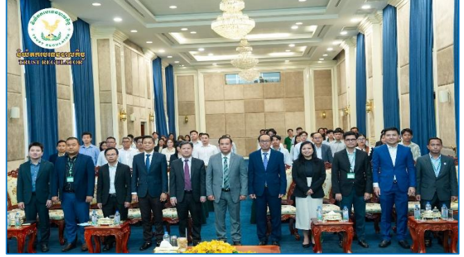
រូបភាព៖ សិក្ខាសាលាផ្សព្វផ្សាយ និងបណ្តុះបណ្តាលយល់ដឹងអំពី "គោលការណ៍ណែនាំស្តីពីការតាមដាន ត្រួតពិនិត្យ និងវាយតម្លៃសមិទ្ធកម្មរបស់ អ.ស.ប. "។