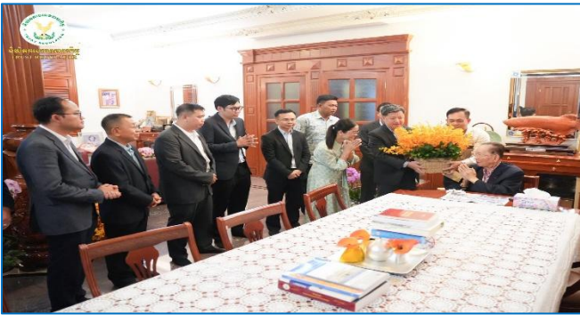
រូបភាព៖ សកម្មភាពថ្នាក់ដឹកនាំនៃ ន.ប.ធ. បានចូលជួបសម្តែងការគួរសម និងសូត្រសុខទុក្ខ សម្តេចសេដ្ឋកិច្ចកិត្តិ ភាត ឈន់។