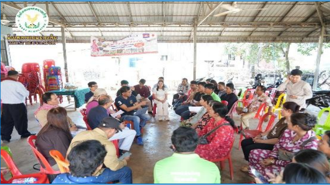
រូបភាព៖ សកម្មភាពអមដំណើរប្រតិភូធនាគារអភិវឌ្ឍន៍អាស៊ី (ADB) ដើម្បីទស្សនកិច្ចវាយតម្លៃឯករាជ្យសម្រាប់គម្រោង ACSEP មូលនិធិ JFPR នៅសហគមន៍កសិកម្ម សំបូរមានជ័យ ខេត្តកំពង់ចាម។