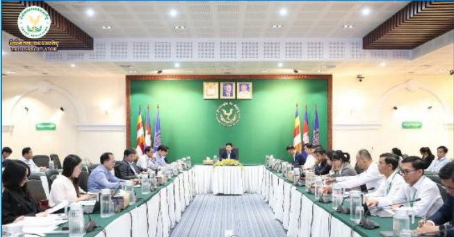
រូបភាព៖ កិច្ចប្រជុំលើសេចក្តីព្រាងប្រកាសស្តីពីការបង្កើតក្រុមការងារកែទម្រង់ច្បាប់នៃក្រសួងសេដ្ឋកិច្ចនិងហិរញ្ញវត្ថុ (កសហវ)។

កិច្ចប្រជុំនេះរៀបចំឡើងក្នុងគោលបំណង ដើម្បីពិនិត្យ និងពិភាក្សាលើការកែទម្រង់ច្បាប់នៃ កសហវ ដើម្បីឱ្យមានការយល់ដឹង និងការបកស្រាយរួមគ្នា ប្រកបដោយសង្គតិភាព សុខុដុមនីយកម្ម ចំពោះច្បាប់ និងបទប្បញ្ញត្តិ ជាពិសេសចូលរួមរៀបចំ និងគ្រោងដាក់ដំណើរការប្រមូលទិន្នន័យច្បាប់ និងបទដ្ឋានគតិយុត្ត ក្រោមសមត្ថកិច្ចរបស់ កសហវ និង អ.ស.ហ. ។