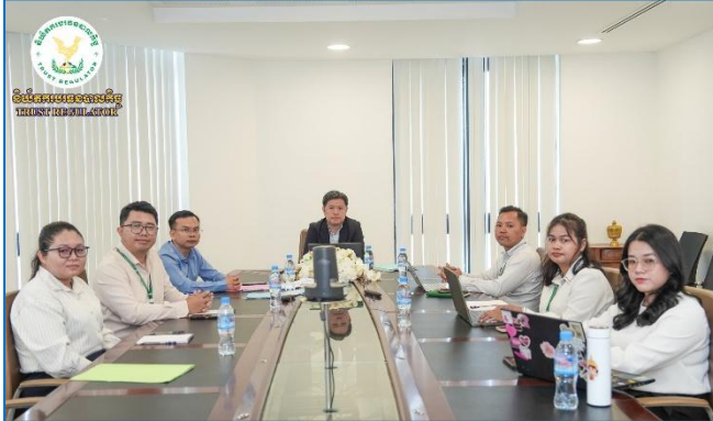
រូបភាព៖ កិច្ចប្រជុំត្រួតពិនិត្យប្រចាំឆ្នាំ២០២៥ លើថវិកាសមិទ្ធកម្មរបស់ក្រសួងសេដ្ឋកិច្ចនិងហិរញ្ញវត្ថុ (កសហ)។

ព្រឹកថ្ងៃអង្គារ ១៣ កើត ខែចេត្រ ឆ្នាំម្សាញ់ សប្តស័ក ព.ស. ២៥៦៩ ត្រូវនឹងថ្ងៃទី៣១ ខែមីនា ឆ្នាំ២០២៦ ឯកឧត្តម សុខ ដារ៉ា អគ្គនាយកនៃនិយ័តករបឋមបាលកិច្ច ( ន.ប.ប. ) អមដោយសហការីបានអញ្ជើញចូលរួមកិច្ចប្រជុំត្រួតពិនិត្យប្រចាំឆ្នាំ២០២៥ លើថវិកាសមិទ្ធកម្មរបស់ក្រសួងសេដ្ឋកិច្ចនិងហិរញ្ញវត្ថុ ( កសហ ) ក្រោមអធិបតីភាពដ៏ខ្ពង់ខ្ពស់របស់ ឯកឧត្តមអគ្គបណ្ឌិតសភាចារ្យ អូន ព័ន្ធមុនីរ័ត្ន ឧបនាយករដ្ឋមន្ត្រី រដ្ឋមន្ត្រី កសហ និងមានការអញ្ជើញចូលរួមពី ឯកឧត្តម លោកជំទាវ លោក លោកស្រី ដែលជាថ្នាក់ដឹកនាំស្ថាប័ន និងអង្គការក្រោមឱវាទ កសហ។ តាមប្រព័ន្ធអនឡាញ Zoom។