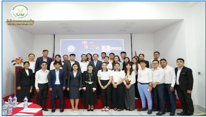
រូបភាព៖ កម្មវិធីបណ្តុះបណ្តាលស្តីពី “យន្តការបរទេសបាលកិច្ចនៅកម្ពុជា”។