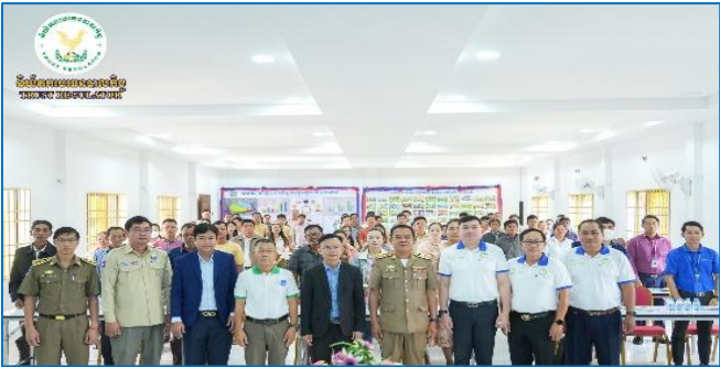
រូបភាព៖ សិក្ខាសាលាស្តីពី “ការផ្សព្វផ្សាយផលិតផលឥណទានក្នុងក្របខណ្ឌគម្រោងប្រកួតប្រជែងខ្សែច្រវាក់តម្លៃ និងការលើកកម្ពស់សុវត្ថិភាពកសិកម្ម (ACSEP) ដល់រដ្ឋបាលខេត្តគោលដៅថ្មី”។