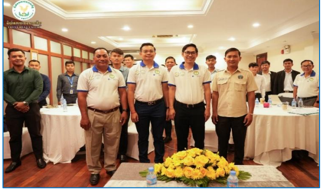
រូបភាព៖ វគ្គបណ្តុះបណ្តាលស្តីពី “ហិរញ្ញប្បទានខ្សែច្រវាក់តម្លៃកសិកម្ម និងប្រព័ន្ធគ្រប់គ្រងបរិស្ថាន និងសង្គម” សម្រាប់មន្ត្រីនៃស្ថាប័នហិរញ្ញវត្ថុដៃគូ និងមន្ត្រីអនុវត្តគម្រោង ACSEP”។