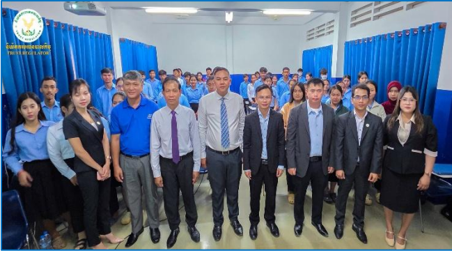
រូបភាព៖ សិក្ខាសាលាស្តីពី “ការល្អប្រសើរឡើងវិញនៃការអភិវឌ្ឍន៍វិស័យបឋមបាលកិច្ចនៅព្រះរាជាណាចក្រកម្ពុជា”។