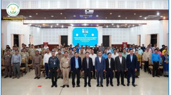
រូបភាព៖ សិក្ខាសាលាស្តីពី “ការបង្កើត និងចុះបញ្ជីបឋមធនបាលកិច្ច អនុលោម តាមច្បាប់ និងបទប្បញ្ញត្តិពាក់ព័ន្ធក្នុងវិស័យបឋមធនបាលកិច្ច”។

កម្មវិធីនេះ មានការអញ្ជើញចូលរួមពីថ្នាក់ដឹកនាំជាន់ខ្ពស់ មន្ត្រីជំនាញនៃ ន.ប.ប. តំណាងក្រសួងមហាផ្ទៃ និងរដ្ឋបាល សាលាខេត្តសៀមរាប និងតំណាងអង្គការ-សមាគមពាក់ព័ន្ធ។