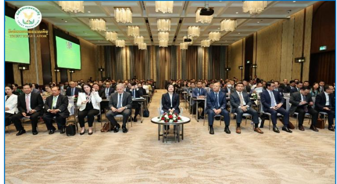
រូបភាព៖ សិក្ខាសាលាផ្សព្វផ្សាយរបាយការណ៍ស្តីពី “ការវាយតម្លៃហានិភ័យ ថ្នាក់ជាតិស្តីពីការសម្អាតប្រាក់ និងហិរញ្ញប្បទានតេររកម្ម លើកទី២”។