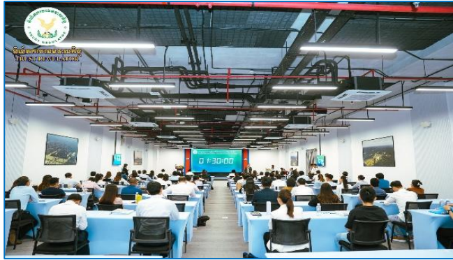
រូបភាព៖ កម្មវិធីប្រឡងគុណវុឌ្ឍិក្នុងវិស័យបេធនបាលកិច្ច លើកទី៨ ឆ្នាំ២០២៦។