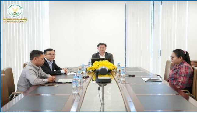
រូបភាព៖ កិច្ចប្រជុំគណៈកម្មាធិការដឹកនាំការងារកែទម្រង់ការគ្រប់គ្រងហិរញ្ញវត្ថុសាធារណៈ ដើម្បីពិនិត្យនិងពិភាក្សាលើរបាយការណ៍តាមដាន និងវាយតម្លៃប្រចាំឆ្នាំ២០២៥ នៃការអនុវត្តកម្មវិធីកែទម្រង់ការគ្រប់គ្រងហិរញ្ញវត្ថុសាធារណៈដំណាក់កាលទី៤។