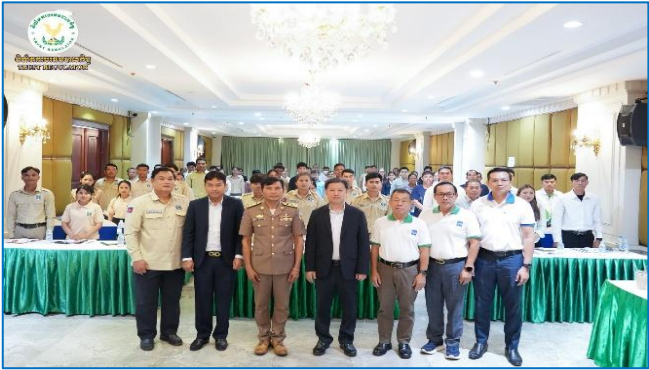
រូបភាព៖ សិក្ខាសាលាស្តីពី "ការផ្សព្វផ្សាយផលិតផលឥណទានក្នុងក្របខណ្ឌគម្រោងប្រកួតប្រជែងខ្សែច្រវាក់តម្លៃ និងការលើកកម្ពស់សុវត្ថិភាពកសិកម្ម (ACSEP) ដល់រដ្ឋបាលខេត្តគោលដៅថ្មី។"

ដែលមានបំណងស្វែងរកហិរញ្ញប្បទាន ដើម្បីគាំទ្រ និងពង្រីកអាជីវកម្មរបស់ខ្លួន។ សិក្ខាសាលានេះ មានការចូលរួមដោយតំណាងសមាជិកសហគមន៍កសិកម្ម, សហគមន៍កសិកម្ម, មន្ត្រីកសិកម្មឃុំ, មន្ត្រី និងទីប្រឹក្សារបស់គម្រោង ACSEP-PIU1, ACSEP-PIU2, តំណាងមន្ទីរកសិកម្ម រុក្ខាប្រមាញ់ និងនេសាទ, និងក្រុមការងារគម្រោងមកពីស្ថាប័នហិរញ្ញវត្ថុដៃគូទាំងពីរ រួមមាន៖ ធនាគារអភិវឌ្ឍន៍ជនបទ និងកសិកម្ម (ARDB) និងធនាគារស្ថាបនា (SPNB)។