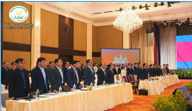
រូបភាព: វេទិកាសាធារណៈ ស្តីពី “ការគ្រប់គ្រងម៉ាក្រូសេដ្ឋកិច្ច និងច្បាប់ថវិកាឆ្នាំ ២០២៦”។

នៅព្រឹកថ្ងៃចន្ទ ១៥កើត ខែមាយ ឆ្នាំម្សាញ់ សប្តស័ក ព.ស. ២៥៦៩ ត្រូវនឹងថ្ងៃទី២ ខែកុម្ភៈ ឆ្នាំ២០២៦ ឯកឧត្តម នង ពិសិដ្ឋ អគ្គនាយករងនៃនិយ័តករបរទេសកិច្ច ( ន.ប.ប. ) តំណាងរបស់ ឯកឧត្តម សុខ ដារ៉ា អគ្គនាយករង ន.ប.ប. អមដោយសហការីបានអញ្ជើញចូលរួមវេទិកាសាធារណៈ ស្តីពី “ការគ្រប់គ្រងម៉ាក្រូសេដ្ឋកិច្ច និងច្បាប់ថវិកាឆ្នាំ ២០២៦” ក្រោមអធិបតីភាពដ៏ខ្ពង់ខ្ពស់របស់ ឯកឧត្តមបណ្ឌិតសភាចារ្យ ជាន់ ផល្លា និង ឯកឧត្តម ចាន់ សុខី រដ្ឋលេខាធិការនៃក្រសួងសេដ្ឋកិច្ច និងហិរញ្ញវត្ថុ នៅសណ្ឋាគារ សូហ្វីតែល ភ្នំពេញក្នុងគ្រា។