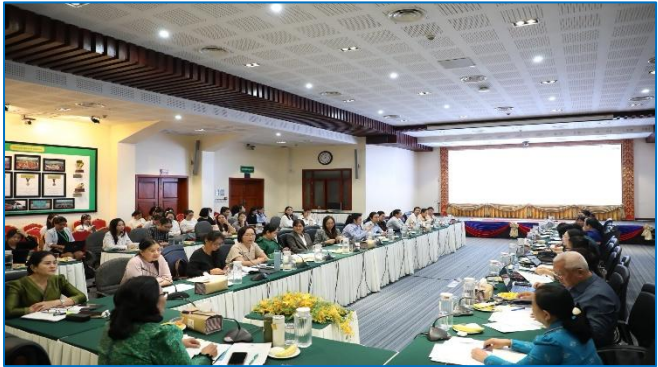
រូបភាព៖ កិច្ចប្រជុំក្រុមការងារបញ្ជ្រាបយេនឌ័រក្រសួងសេដ្ឋកិច្ច និងហិរញ្ញវត្ថុ (កសហវ)។

កិច្ចប្រជុំនេះរៀបចំឡើងក្នុងគោលបំណង ដើម្បីពិនិត្យ និងពិភាក្សាលើសមិទ្ធផលការងារឆ្នាំ២០២៥ និងទិសដៅបន្តការងារឆ្នាំ២០២៦។