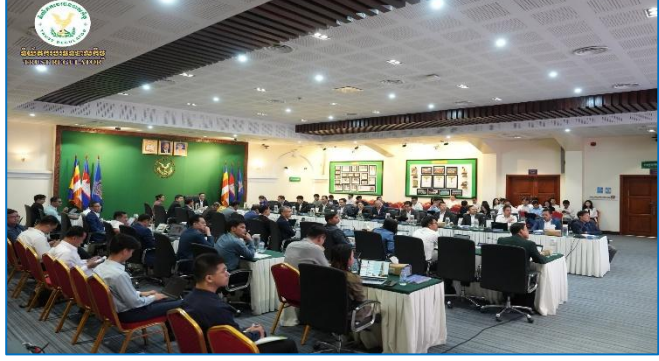
រូបភាព៖ កិច្ចប្រជុំអន្តរក្រសួងស្តីពី “ការពិគ្រោះយោបល់ប្រមូលធាតុចូលលើសេចក្តីព្រាងយុទ្ធសាស្ត្រជាតិស្តីពីការអភិវឌ្ឍធុរកិច្ចថ្មី ២០២៦-២០៣០”។