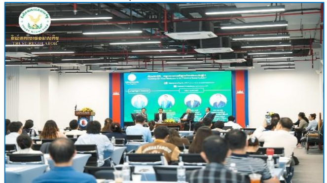
រូបភាព៖ សិក្ខាសាលាស្តីពី “យន្តការបេធនបាលកិច្ចក្នុងបរិបទនៃការវិនិយោគ”។

នាព្រឹកថ្ងៃចន្ទ ៧ រោច ខែមាយ ឆ្នាំម្សាញ់ សប្តស័ក ព.ស. ២៥៦៩ ត្រូវនឹងថ្ងៃទី៩ ខែកុម្ភៈ ឆ្នាំ២០២៦ និយ័តករបេធនបាលកិច្ច (ន.ប.ប.) ដែលជាអង្គការអនុវត្តគម្រោងប្រកួតប្រជែងខ្សែច្រវាក់ តម្លៃ និងការលើកកម្ពស់សុវត្ថិភាពកសិកម្ម សមាសភាគទី១ (ACSEP-PIU1) ក្នុងក្របខណ្ឌក្រសួងសេដ្ឋកិច្ចនិងហិរញ្ញវត្ថុ បានរៀបចំ សិក្ខាសាលាស្តីពី “ការផ្សព្វផ្សាយផលិតផលឥណទានក្នុងក្របខណ្ឌ គម្រោងប្រកួតប្រជែងខ្សែច្រវាក់តម្លៃ និងការលើកកម្ពស់សុវត្ថិភាព កសិកម្ម (ACSEP) ដល់រដ្ឋបាលខេត្តគោលដៅថ្មី” សម្រាប់ខេត្ត- ពោធិ៍សាត់ នៅសណ្ឋាគារពោធិ៍សាត់វីរីសាយ ក្រោមអធិបតីភាព របស់ ឯកឧត្តម សុខ ដារ៉ា អគ្គនាយកនៃនិយ័តករបេធនបាលកិច្ច និងជាប្រធានគ្រប់គ្រងគម្រោង ACSEP-PIU1 និង ឯកឧត្តម ឆឹម សុខតុ អភិបាលរងខេត្តពោធិ៍សាត់ អមដោយ លោក ប៉ូ សំអាង ប្រធាននាយកដ្ឋានស្រាវជ្រាវ បណ្តុះបណ្តាល និងសហប្រតិបត្តិការ និងជាប្រធានផ្នែកប្រតិបត្តិការនៃគម្រោង ACSEP-PIU1 និង លោក ហៃ ធុរ៉ា ប្រធានមន្ទីរកសិកម្ម រុក្ខាប្រមាញ់ និងនេសាទ ខេត្ត- ពោធិ៍សាត់។ កម្មវិធីនេះ រៀបចំឡើងក្នុងគោលបំណងផ្សព្វផ្សាយអំពី សារៈសំខាន់ និងបច្ចុប្បន្នភាពនៃគម្រោង ACSEP ជាពិសេសគោលនយោបាយ ឥណទាន បែបបទ និងនីតិវិធីក្នុងការរៀបចំស្នើសុំឥណទាននៃគម្រោង ACSEP ដែលជាឥណទានមានលក្ខខណ្ឌអនុគ្រោះ និងគាំទ្រដល់ សមាជិកសហគមន៍កសិកម្ម និងកសិករដែលស្ថិតនៅខេត្តពោធិ៍សាត់ ដែលមានបំណងស្វែងរកហិរញ្ញប្បទាន ដើម្បីគាំទ្រ និងពង្រីកអាជីវកម្ម របស់ខ្លួន។