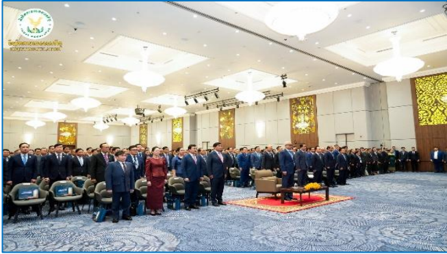
រូបភាព៖ កម្មវិធី “វេទិកាស្តីពីពន្ធដារ-Tax Forum”។

កម្មវិធីនេះ សហការរៀបចំដោយអគ្គនាយកដ្ឋានពន្ធដារ និងសភាពណិជ្ជកម្មកម្ពុជា ក្នុងគោលបំណងប្រកាសបើកឱ្យដំណើរការប្រព័ន្ធ Tax Home Pay, កិច្ចពិភាក្សា និងដោះស្រាយបញ្ហាប្រឈមនានាពាក់ព័ន្ធភាគព្វកិច្ចពន្ធដារមួយវិស័យឯកជនព្រមទាំងលើកកម្ពស់អនុលោមភាពសារពើពន្ធដើម្បីបន្តអភិវឌ្ឍសេដ្ឋកិច្ចកម្ពុជា ដោយមានការអញ្ជើញចូលរួមពី ឯកឧត្តម លោកជំទាវ លោក លោកស្រីដែលជាថ្នាក់ដឹកនាំ ក្រសួង ស្ថាប័ន អង្គការ តំណាងសភាពណិជ្ជកម្មកម្ពុជា និងវិស័យឯកជន នៅអគារអគ្គនាយកដ្ឋានពន្ធដារ (GDT Tower)។