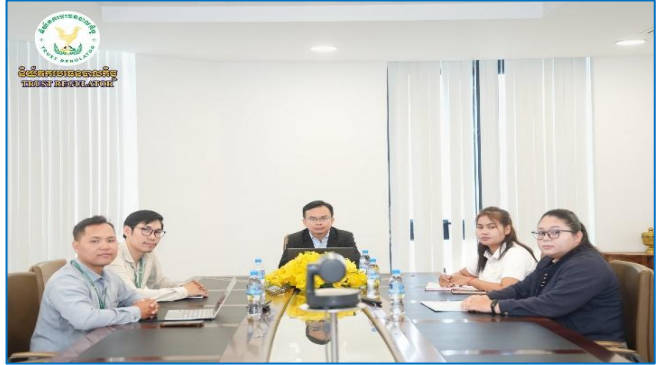
រូបភាព៖ កិច្ចប្រជុំបច្ចេកទេសជាមួយតំណាងដៃគូអភិវឌ្ឍ ពិនិត្យនិងភិកាក្សាលើរបាយការណ៍តាមដាននិងវាយតម្លៃប្រចាំឆ្នាំ២០២៥ នៃការអនុវត្តកម្មវិធីកែទម្រង់ការគ្រប់គ្រងហិរញ្ញវត្ថុសាធារណៈ ដំណាក់កាលទី៤។ ទំព័រទី៦