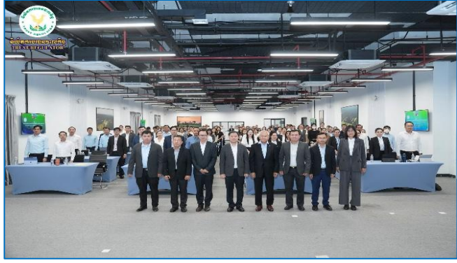
រូបភាព: វគ្គបណ្តុះបណ្តាល និងការប្រឡងគុណតុដ្ឋីនិងកម្មវិធីអប់រំវិជ្ជាជីវៈបណ្តុះបណ្តាលវិស័យបរទេសកិច្ច លើកទី៨។

វគ្គបណ្តុះបណ្តាលនេះ ត្រូវបានរៀបចំរយៈពេលចំនួន ៣ ថ្ងៃពេញ ចាប់ពីថ្ងៃទី៣-៥ ខែកុម្ភៈ ឆ្នាំ២០២៦និងមានអ្នកចូលរួមសរុបចំនួន ១៤៨ រូប ដែលមានសមាសភាពចូលរួមពីក្រុមហ៊ុននិងបុគ្គលពាក់ព័ន្ធដែលផ្តល់សេវាក្នុងវិស័យបរទេសកិច្ច, បុគ្គលដែលមានបំណងផ្តល់សេវាក្នុងវិស័យបរទេសកិច្ច និងសាធារណជន។