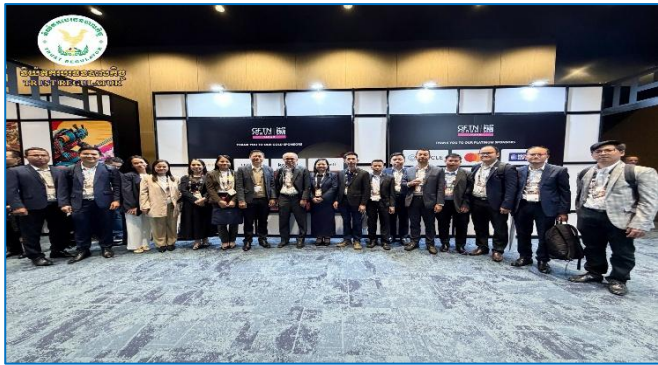
រូបភាព៖ វេទិកាបណ្តាញហិរញ្ញវត្ថុ និងបច្ចេកវិទ្យាសកលជប៉ុន ឆ្នាំ២០២៦។