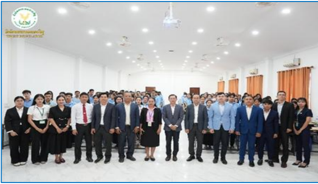
រូបភាព: សិក្ខាសាលាស្តីពី “ការឈ្វេងយល់ពីកិច្ចដំណើរការអភិវឌ្ឍន៍វិស័យបរទេសកិច្ចនៅព្រះរាជាណាចក្រកម្ពុជា”។