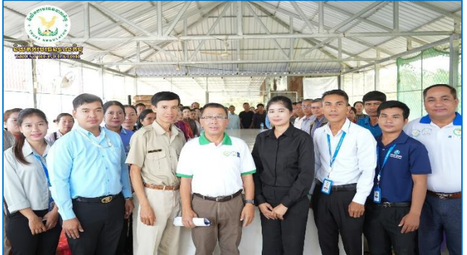
រូបភាព៖ សិក្ខាសាលាស្តីពី “ការផ្សព្វផ្សាយផលិតផលឥណទានក្នុងក្របខណ្ឌ គម្រោងប្រកួតប្រជែងខ្សែប្រាក់តម្លៃ និងការលើកកម្ពស់សុវត្ថិភាពកសិកម្ម ដល់ រដ្ឋបាលខេត្តគោលដៅថ្មី”។ ទំព័រទី៧

សិក្ខាសាលានេះ មានការចូលរួមដោយ សមាជិក/សមាជិកា សហគមន៍កសិកម្ម, មន្ត្រី និងទីប្រឹក្សារបស់ ACSEP-PIU1, តំណាង មន្ទីរកសិកម្ម រុក្ខាប្រមាញ់ និងនេសាទ ខេត្តបន្ទាយមានជ័យ, និង ក្រុមការងារគម្រោងមកពីស្ថាប័នហិរញ្ញវត្ថុដៃគូទាំងពីរ រួមមាន៖ ធនាគារអេក្រិឌ្រនីជនបទ និងកសិកម្ម ( ARDB ) និងធនាគារស្ថាបនា ( Sathapana Bank )។