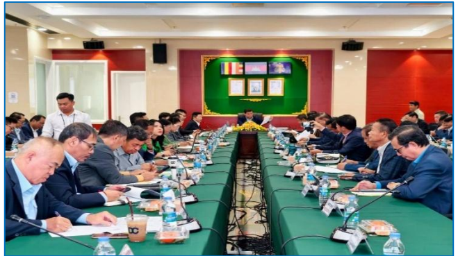
រូបភាព៖ កិច្ចប្រជុំអន្តរក្រសួងស្តីពីការពិនិត្យ និងពិភាក្សាលើ “សេចក្តីព្រាងយុទ្ធសាស្ត្រជាតិស្តីពីការបង្កើតមូលនិធិកីឡាជនពិការ តេជោសែន”។