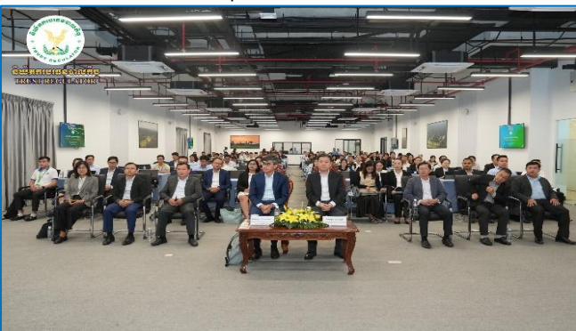
រូបភាព៖ កម្មវិធីសិក្ខាសាលាស្តីពី “បច្ចុប្បន្នភាពនៃសេដ្ឋកិច្ចកម្ពុជា”។

កម្មវិធីនេះមានការអញ្ជើញចូលរួមពីថ្នាក់ដឹកនាំជាន់ខ្ពស់នៃ ន.ប.ធន. និងមន្ត្រីជំនាញ និងលោក លោកស្រីតំណាងឱ្យនិយ័តករទាំងអស់ក្រោមឱវាទរបស់អាជ្ញាធរសេវាហិរញ្ញវត្ថុមិនមែនធនាគារ ( អ.ស.ហ. ) និងតំណាងក្រុមហ៊ុនបរធនបាល ប្រតិបត្តិករបរធនបាលផ្តល់សេវារក្សាសុវត្ថិភាព ឬសេវារក្សាទុកក្នុងវិស័យបរធនបាលកិច្ចក្រុមហ៊ុនវាយតម្លៃក្នុងវិស័យបរធនបាលកិច្ច ក្រុមហ៊ុនផ្តល់សេវាសវនកម្ម និងបុគ្គលផ្តល់សេវាពាក់ព័ន្ធក្នុងវិស័យបរធនបាលកិច្ចព្រមទាំងសិក្ខាកាមនៃកម្មវិធីវគ្គបណ្តុះបណ្តាល និងការប្រឡងគុណវុឌ្ឍិ និងកម្មវិធីអប់រំវិជ្ជាជីវៈបន្ត ក្នុងវិស័យបរធនបាលកិច្ច លើកទី៨ ផងដែរ។