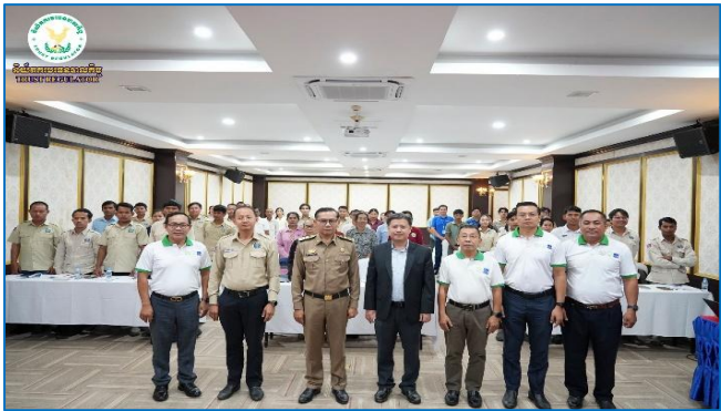
រូបភាព៖ សិក្ខាសាលាស្តីពី “ការផ្សព្វផ្សាយផលិតផលឥណទានក្នុងក្របខណ្ឌគម្រោងប្រកួតប្រជែងខ្សែច្រវាក់តម្លៃ និងការលើកកម្ពស់សុវត្ថិភាពកសិកម្ម (ACSEP) ដល់រដ្ឋបាលខេត្តគោលដៅថ្មី”។

សិក្ខាសាលានេះ មានការចូលរួមដោយតំណាងសមាជិក/សមាជិកាសហគមន៍កសិកម្ម, មន្ត្រី និងទីប្រឹក្សារបស់គម្រោង ACSEP-PIU1, តំណាងមន្ទីរកសិកម្ម រុក្ខាប្រមាញ់ និងនេសាទ, និងក្រុមការងារគម្រោងមកពីស្ថាប័នហិរញ្ញវត្ថុដៃគូទាំងពីររួមមាន៖ ធនាគារអភិវឌ្ឍន៍ជនបទ និងកសិកម្ម (ARDB) និងធនាគារស្ថាបនា (Sathapana Bank)។