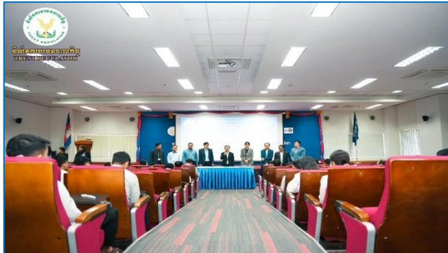
រូបភាព៖ ការប្រឡងជ្រើសរើសមន្ត្រីលក្ខន្តិកៈរបស់អាជ្ញាធរសេវាហិរញ្ញវត្ថុមិនមែនធនាគារ (អ.ស.ហ.) សម្រាប់ចូលបម្រើការងារនៅ ន.ប.ធន.។

លោកអគ្គនាយករង ក៏បានមានប្រសាសន៍ថា ការប្រឡងប្រជែងនេះគឺជាផ្តល់ឱកាសស្មើគ្នាសម្រាប់បេក្ខជន-បេក្ខនារី ទាំងអស់ ដែលឈរលើគោលការណ៍តម្លាភាព និងយុត្តិធម៌។