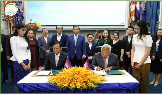
រូបភាព៖ កម្មវិធីចុះអនុស្សាវរីយ៍នៃការយោគយល់គ្នាជាអគ្គលេខាធិការដ្ឋានអាជ្ញាធរសេវាហិរញ្ញវត្ថុមិនមែនធនាគារ (អ.ម.ម.) និងវិទ្យាស្ថានហិរញ្ញវត្ថុ និងគណនេយ្យ។