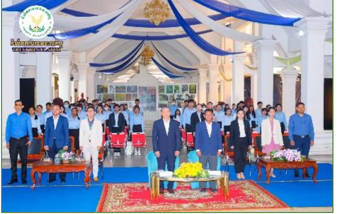
រូបភាព៖ សិក្ខាសាលាស្តីពី “ការឈ្វេងយល់ពីកិច្ចដំណើរការអភិវឌ្ឍន៍វិស័យបរធនបាលកិច្ចនៅព្រះរាជាណាចក្រកម្ពុជា”។

សិក្ខាសាលានេះត្រូវបានរៀបចំឡើងក្នុងគោលដៅបញ្ជាក់ការយល់ដឹងជាសាធារណៈឱ្យបានកាន់តែទូលំទូលាយ និងស៊ីជម្រៅសម្រាប់និស្សិតនៅសាកលវិទ្យាល័យ អំពីយន្តការប្រតិបត្តិការបរធនបាលកិច្ច បទដ្ឋានគតិយុត្តពាក់ព័ន្ធ គុណប្រយោជន៍នៃវិស័យបរធនបាលកិច្ច។ សិក្ខាសាលានេះក៏បានផ្តល់ឱកាសដល់និស្សិតដើម្បីធ្វើការបង្កើនចំណេះដឹងបន្ថែមពាក់ព័ន្ធនឹងវិស័យហិរញ្ញវត្ថុមិនមែនធនាគារផងដែរ។ កម្មវិធីនេះ មានការអញ្ជើញចូលរួមពីថ្នាក់ដឹកនាំជាន់ខ្ពស់នៃ ន.ប.ប. និងមន្ត្រីជំនាញ, សាស្ត្រាចារ្យ និងនិស្សិតនៃសាកលវិទ្យាល័យន័រតុន។