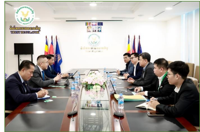
រូបភាព៖ កិច្ចប្រជុំពិភាក្សាការងាររវាង ឧ.ប.ឆ. និងថ្នាក់ដឹកនាំនៃធនាគារវឌ្ឍនៈ។