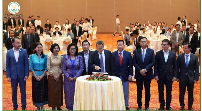
រូបភាព: ពិធី “ប្រកាសដាក់ឱ្យប្រើប្រាស់ FMIS ជំនាន់ថ្មីជាផ្លូវការ និងប្រើប្រាស់ សាកល្បងកម្មវិធីកញ្ចប់ថវិកាតាមទូរសព្ទដៃជំនាន់ទី១ ក្នុងក្របខណ្ឌក្រសួង សេដ្ឋកិច្ចនិងហិរញ្ញវត្ថុ”។