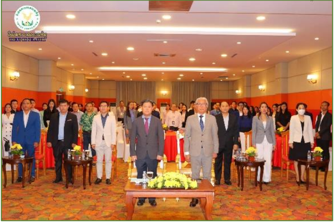
រូបភាព៖ កម្មវិធីបណ្តុះបណ្តាលស្តីពី “យន្តការបរធនបាលកិច្ចនៅកម្ពុជា”។

នាយកប្រតិបត្តិនៃធនាគារ ស៊ីអាយអិមប៊ី ភីអិលស៊ី ដែលបានប្រព្រឹត្ត ទៅនៅសណ្ឋាគារ សុខា ភ្នំពេញ។ កម្មវិធីបណ្តុះបណ្តាលនេះ ត្រូវបាន រៀបចំឡើង ក្នុងគោលបំណងបញ្ឈប់ការយល់ដឹងបន្ថែមអំពីយន្តការ បរធនបាលកិច្ចនៅកម្ពុជា ដល់ថ្នាក់ដឹកនាំ និងបុគ្គលិកទទួលបន្ទុក មកពីទីស្នាក់ការកណ្តាល និងបណ្តាសាខារបស់ធនាគារ CIMB នៅ រាជធានីភ្នំពេញ ដែលធ្វើប្រតិបត្តិការពាក់ព័ន្ធនឹងបរធនបាលកិច្ច ក៏ដូចជាអតិថិជនរបស់ធនាគារ CIMB ដែលជាធនាគារទទួលបាន អាជ្ញាបណ្ណពី ន.ប.ប. ធ្វើជាក្រុមហ៊ុនបរធនបាលធ្វើប្រតិបត្តិការ គ្រប់គ្រង, ចាត់ចែង និងប្រតិបត្តិការរក្សាសុវត្ថិភាព ឬរក្សាទុក សម្រាប់ ប្រតិបត្តិការបរធនបាលកិច្ចពាណិជ្ជកម្ម។