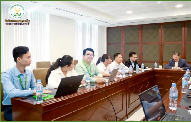
រូបភាព៖ កិច្ចប្រជុំបូកសរុបសមិទ្ធផលការងារប្រចាំខែឧសភា ឆ្នាំ២០២៤ របស់នាយកដ្ឋានកិច្ចការទូទៅ។