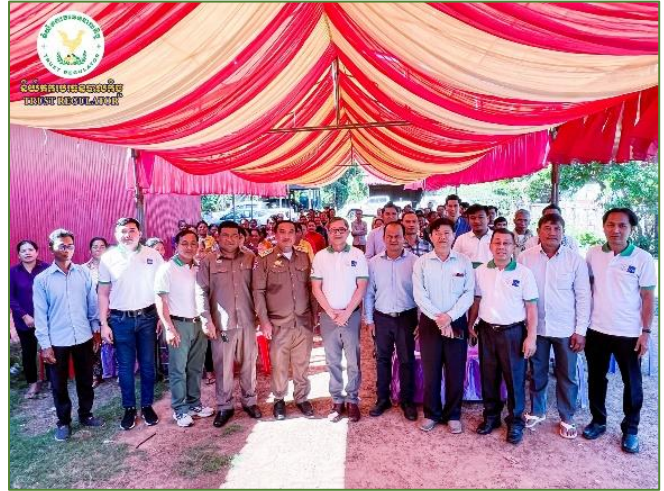
រូបភាព៖ សិក្ខាសាលាស្តីពី “ការផ្សព្វផ្សាយផលិតផលឥណទានដល់សមាជិក សហគមន៍” នៅខេត្តព្រះវិហារ។

កម្មវិធីនេះ មានការចូលរួមដោយ សមាជិក/សមាជិកា និង ទីប្រឹក្សារបស់ ACSEP PIU1, ប្រធានមន្ទីរកសិកម្ម រុក្ខាប្រមាញ់ និងនេសាទខេត្តព្រះវិហារ, តំណាងអភិបាលស្រុក និងក្រុមការងារ មកពីស្ថាប័នហិរញ្ញវត្ថុដៃគូទាំងពីររួមមាន ធនាគារអភិវឌ្ឍន៍ជនបទ និងកសិកម្ម និងធនាគារស្ថាបនា។