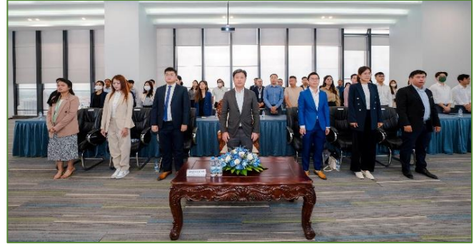
រូបភាព: កម្មវិធីបណ្តុះបណ្តាលស្តីពី “យន្តការបរិច្ចាគបាលកិច្ចនៅកម្ពុជា”។

នារសៀលថ្ងៃសៅរ៍ ៨ រោច ខែជេស្ឋ ឆ្នាំរោង ឆស័ក ព.ស. ២៥៦៨ ត្រូវនឹងថ្ងៃទី២៩ ខែមិថុនា ឆ្នាំ២០២៤ និយ័តករបរិច្ចាគបាលកិច្ច ( ខ.ប.ឆ. ) និងសាកលវិទ្យាល័យភូមិន្ទនីតិសាស្ត្រ និងវិទ្យាសាស្ត្រសេដ្ឋកិច្ច បានសហការគ្នារៀបចំសិក្ខាសាលាស្តីពី “ក្របខណ្ឌច្បាប់ និងបទប្បញ្ញត្តិពាក់ព័ន្ធក្នុងវិស័យបរិច្ចាគបាលកិច្ច” ក្រោមអធិបតីភាពរបស់ ឯកឧត្តម សុខ ដារ៉ា អគ្គនាយកនៃនិយ័តករ បរិច្ចាគបាលកិច្ច និង លោកបណ្ឌិត សៀង សោភ័ណ សាកលវិទ្យា ធិការរងនៃសាកលវិទ្យាល័យភូមិន្ទនីតិសាស្ត្រ និងវិទ្យាសាស្ត្រ សេដ្ឋកិច្ច នៅសាកលវិទ្យាល័យភូមិន្ទនីតិសាស្ត្រ និងវិទ្យាសាស្ត្រ សេដ្ឋកិច្ច ។