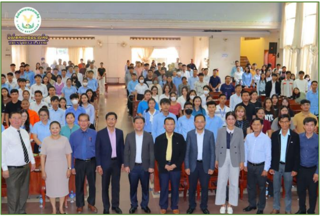
រូបភាព: សិក្ខាសាលាស្តីពី “ក្របខណ្ឌច្បាប់ និងបទប្បញ្ញត្តិពាក់ព័ន្ធក្នុង វិស័យបរិច្ចាគបាលកិច្ច”។

សិក្ខាសាលានេះត្រូវបានរៀបចំឡើងក្នុងគោលដៅបញ្ជ្រាប ការយល់ដឹងជាសាធារណៈឱ្យបានកាន់តែទូលំទូលាយ និងស៊ីជម្រៅ សម្រាប់និស្សិតនៅសាកលវិទ្យាល័យ អំពីយន្តការប្រតិបត្តិការ បរិច្ចាគបាលកិច្ច បទដ្ឋានគតិយុត្តពាក់ព័ន្ធ គុណប្រយោជន៍នៃវិស័យ បរិច្ចាគបាលកិច្ច។ សិក្ខាសាលានេះក៏បានផ្តល់ឱកាសដល់និស្សិត ដើម្បីធ្វើការបង្កើនចំណេះដឹងបន្ថែមពាក់ព័ន្ធនឹងវិស័យហិរញ្ញវត្ថុមិនមែន ធនាគារផងដែរ។ កម្មវិធីនេះ មានការអញ្ជើញចូលរួមពីថ្នាក់ដឹកនាំ ជាន់ខ្ពស់នៃ ខ.ប.ឆ. និងមន្ត្រីជំនាញ, សាស្ត្រាចារ្យ, និងនិស្សិត នៃសាកលវិទ្យាល័យភូមិន្ទនីតិសាស្ត្រ និងវិទ្យាសាស្ត្រសេដ្ឋកិច្ច ដែលមានចំនួនសរុបប្រមាណ ៤០០ នាក់។