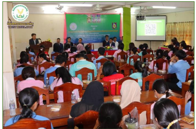
រូបភាព៖ សិក្ខាសាលាស្តីពី “ការឈ្វេងយល់ពីកិច្ចដំណើរការអភិវឌ្ឍន៍វិស័យបរទេសបាលកិច្ចនៅព្រះរាជាណាចក្រកម្ពុជា”។