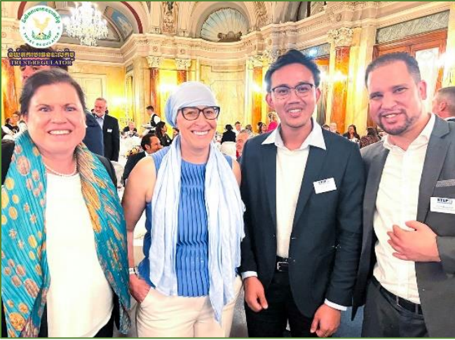
រូបភាព៖ សន្និសីទ Alpine ប្រចាំឆ្នាំ២០២៤ ស្តីពី "ទ្រព្យសម្បត្តិឯកជន៖ ការគំរាម និងបច្ចេកវិទ្យា"។