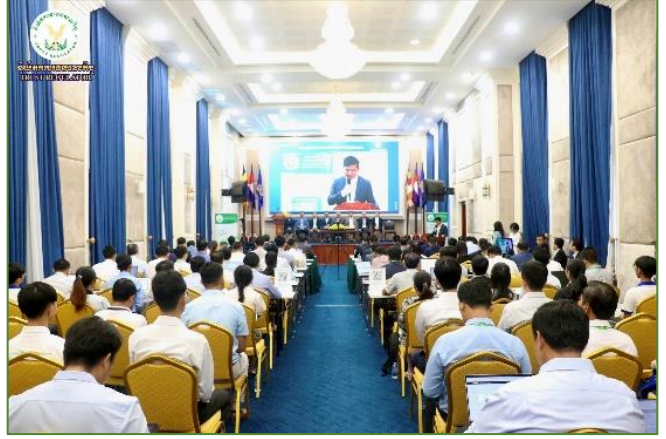
រូបភាព៖ សិក្ខាសាលាស្តីពី "ការជំរុញការប្រើប្រាស់ និងការអភិវឌ្ឍថ្នាល ឌីជីថលគ្រឹះក្នុងវិស័យហិរញ្ញវត្ថុមិនមែនធនាគារ"។

នាព្រឹកថ្ងៃអង្គារ ៤រោច ខែជេស្ឋ ឆ្នាំរោង ឆស័ក ព.ស. ២៥៦៨ ត្រូវនឹងថ្ងៃទី២៥ ខែមិថុនា ឆ្នាំ២០២៤ ឯកឧត្តម ឈី សាកល អគ្គនាយកនៃនិយ័តករបរិយបរណាបាលកិច្ច ( ឧ.ប.ឆ. ) តំណាងដ៏ខ្ពង់ខ្ពស់ របស់ ឯកឧត្តម សុខ ដារ៉ា អគ្គនាយកនៃ ឧ.ប.ឆ. និងសហការី បានអញ្ជើញចូលរួមសិក្ខាសាលាស្តីពី "ការជំរុញការប្រើប្រាស់ និង ការអភិវឌ្ឍថ្នាលឌីជីថលគ្រឹះក្នុងវិស័យហិរញ្ញវត្ថុមិនមែនធនាគារ" ក្រោមអធិបតីភាពរបស់ ឯកឧត្តម គុយ សាចុន អគ្គលេខាធិការរង នៃអគ្គលេខាធិការដ្ឋានអាជ្ញាធរសេវាហិរញ្ញវត្ថុមិនមែនធនាគារ ( អ.ស.ហ. ) តំណាងដ៏ខ្ពង់ខ្ពស់របស់ ឯកឧត្តម ម៉ី វ៉ាន់ រដ្ឋលេខា ធិការក្រសួងសេដ្ឋកិច្ចនិងហិរញ្ញវត្ថុ និងជាអគ្គលេខាធិការនៃ អគ្គលេខាធិការដ្ឋាន អ.ស.ហ. និងមានការអញ្ជើញចូលរួមពីនិយ័តករ និងអង្គការក្រោមឱវាទ អ.ស.ហ. , ក្រសួង-ស្ថាប័នពាក់ព័ន្ធ និង វិស័យឯកជន នៅទីស្តីការ អ.ស.ហ. ។