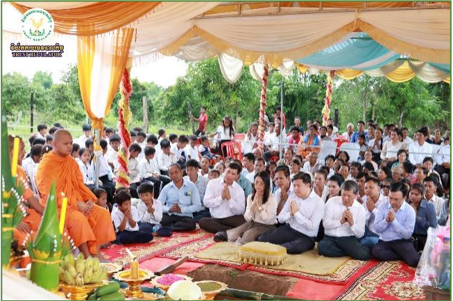
រូបភាព៖ ការបញ្ចុះបឋមសិលាបើកការដ្ឋានសាងសង់អគារសាលាបឋមសិក្សាថ្មី។

ជាមួយគ្នានេះ ក្រុមការងារ អ.ម.ម. ក៏មានការផ្តល់ជូនអំណោយ និងសម្ភារៈសិក្សាមួយចំនួន ដល់លោកតា លោកយាយចាស់ភូមិ និងសិស្សានុសិស្សផងដែរ។