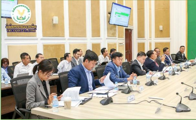
រូបភាព៖ កិច្ចប្រជុំក្រុមការងារអន្តរក្រសួង ដើម្បីពិនិត្យនិងពិភាក្សាលើសេចក្តីព្រាងអនុក្រឹត្យស្តីពីបែបបទសម្រាប់អនុវត្តចំពោះការអនុញ្ញាតឱ្យជនបរទេសមិនមែនអន្តោប្រវេសន៍ ចូល ចេញ និងស្នាក់នៅព្រះរាជាណាចក្រកម្ពុជា។ ទំព័រទី២