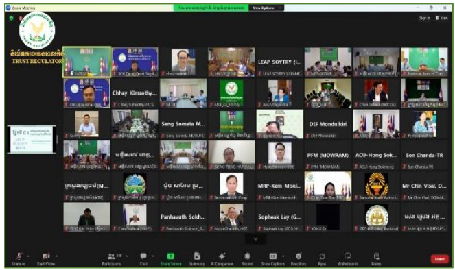
រូបភាព៖ កិច្ចប្រជុំគណៈកម្មការកែទម្រង់ការគ្រប់គ្រងហិរញ្ញវត្ថុសាធារណៈ។

នាព្រឹកថ្ងៃពុធ ១៤រោច ខែពិសាខ ឆ្នាំរោង ឆស័ក ព.ស. ២៥៦៨ ត្រូវនឹងថ្ងៃទី៥ ខែមិថុនា ឆ្នាំ២០២៤ ឯកឧត្តម សុខ ដារ៉ា អគ្គនាយកនៃនិយ័តករបរធនបាលកិច្ច ( ន.ប.ប. ) អមដោយ លោក យុន វាសនា ប្រធាននាយកដ្ឋានកិច្ចការទូទៅនៃ ន.ប.ប. និងសហការី បានអញ្ជើញចូលរួមកិច្ចប្រជុំគណៈកម្មការកែទម្រង់ការគ្រប់គ្រងហិរញ្ញវត្ថុសាធារណៈ ដើម្បីពិនិត្យ និងពិភាក្សាលើរបាយការណ៍សមិទ្ធកម្មប្រចាំត្រីមាសទី១ ឆ្នាំ២០២៤ ក្រោមអធិបតីភាពដ៏ខ្ពង់ខ្ពស់របស់ ឯកឧត្តមអគ្គបណ្ឌិតសភាចារ្យ អូន ព័ន្ធមុនីរ័ត្ន ឧបនាយករដ្ឋមន្ត្រី រដ្ឋមន្ត្រីក្រសួងសេដ្ឋកិច្ចនិងហិរញ្ញវត្ថុ និងមានការអញ្ជើញចូលរួមពី ឯកឧត្តម លោកជំទាវ លោក លោកស្រីដែលជាថ្នាក់ដឹកនាំ ក្រសួង ស្ថាប័ន អង្គភាព និងរដ្ឋបាលថ្នាក់ក្រោមជាតិ តាមប្រព័ន្ធអនឡាញ Zoom។