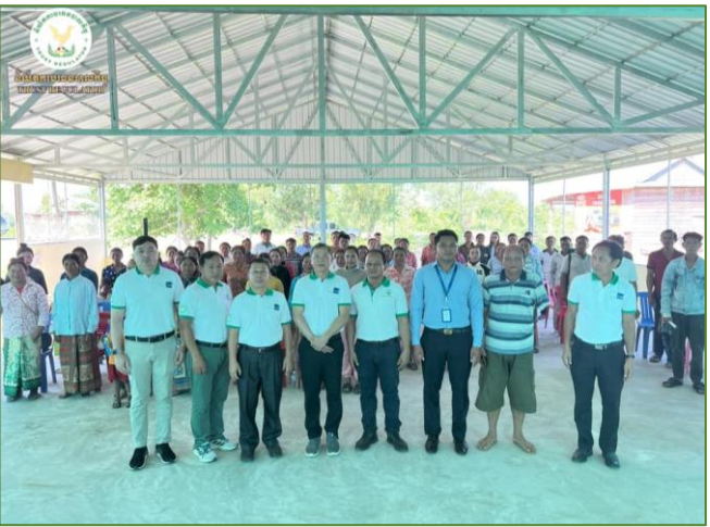
រូបភាព៖ ការផ្សព្វផ្សាយការងារពាក់ព័ន្ធនឹងផលិតផលឥណទានក្នុងគម្រោង ACSEP ដល់សមាជិកសហគមន៍។

កម្មវិធីខាងលើ មានការចូលរួមដោយ សមាជិក/សមាជិកា និងទីប្រឹក្សារបស់ ACSEP PIU1, តំណាងមន្ទីរកសិកម្ម រុក្ខាប្រមាញ់ និងនេសាទខេត្តព្រះវិហារ, អភិបាលរងស្រុក, ក្រុមប្រឹក្សាឃុំ និងក្រុមការងារមកពីស្ថាប័នហិរញ្ញវត្ថុដៃគូទាំងពីរ រួមមាន ធនាគារអភិវឌ្ឍន៍ជនបទនិងកសិកម្ម និងធនាគារស្ថាបនា។